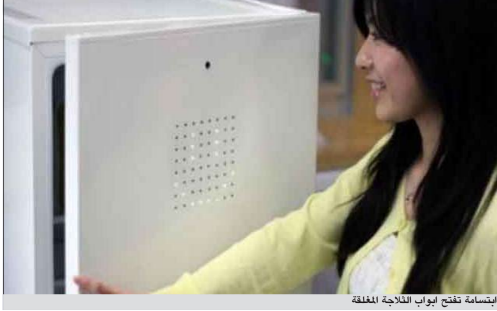
ابتسامه تفتح ابواب الثلاجة المغلقة

ان ينتشر مستقبلاً هذا المفهوم الخاص بـ «عداد السعادة» في مناحي أخرى من الحياة للعمل على نشر البسمة والسعادة، خصوصاً انه قد يكون مفيداً لزيادة الانتاجية في بيئات العمل المختلفة.