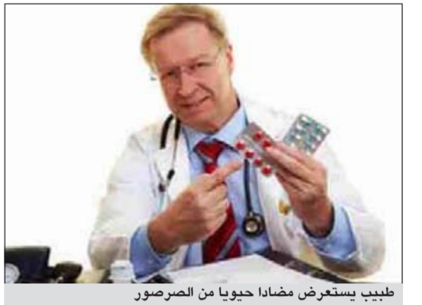
طبيب يستعرض مضاداً حيوياً من الصرصور

تجري دراسات مكثفة على الصرصور بعدما اكتشف الباحثون انه يفرز جزئيات بإمكانها ان تحل محل المضادات الحيوية التي نستعملها اليوم، وجد في جهاز الصراصير العصبي، حوالي تسعة أنواع من الجزئيات التي بإمكانها ان تقتل أكثر من 90٪ من المكوروبات العفوية الذهبية والاشريكية القولونية، ويعود السبب وراء حملها لهذه الجزئيات في انها غالباً ما تعيش في بيئة مصابة بالبكتيريا وبالكائنات الحية الدقيقة المسببة للأمراض، حيث تعلمت كيف تحمي نفسها.