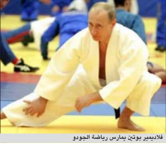
فلاديمير بوتين يمارس رياضة الجودو

لوزان - يو.بي.أي: يبدو أن الرئيس الروسي فلاديمير بوتين يحقق الإنجاز تلو الآخر، لاسيما على الصعيد الرياضي، فقد أعلن الاتحاد الدولي للجودو أن بوتين حصل على الدان الثامن في هذه الرياضة. وقال ماريوس فيزيير رئيس الاتحاد الدولي للجودو في بيان نشر على موقع الاتحاد الإلكتروني أنه لشرف عظيم لنا ولكل مجتمع الجودو أن يكون في صفوفنا شخصية رفيعة المستوى من حيث سمعتها وموقعها.