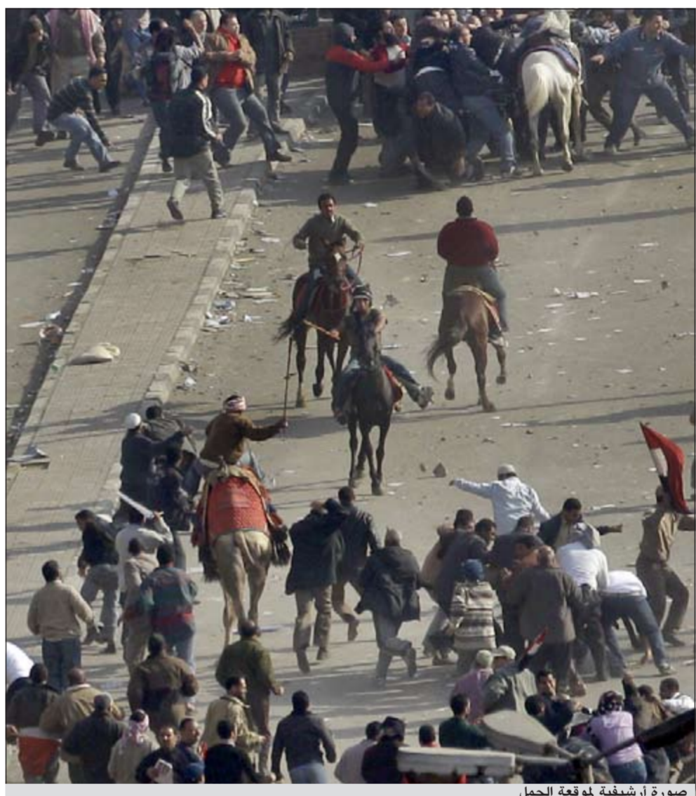
صورة أرشيفية لموقعة الجمل

وكانت جماعة الإخوان المسلمين في مقدمة الداعين إلى الاحتجاج اليوم في «مليونية حق الشهداء» لطلبة الرئيس د.محمد مرسي بتنفيذ وعده بالقصاص من قتلة المتظاهرين. وعبر الأمين العام للإخوان المسلمين بمصر د.محمود حسين عن صدمة الجماعة بعد تيرة المتهمين، لأنه لم يحمل المحكمة مسؤولية الحكم، مشيراً إلى أن