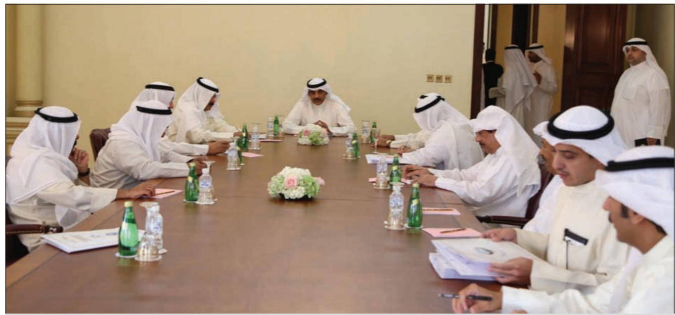
الشيخ صباح الخالد مترئسا احد الاجتماعات التحضيرية لمؤتمر القمة

وتسخر الكويت جميع جهودها لاستقبال هذا الحدث المهم الذي يعد احدى ثمرات الرؤية الاقتصادية والتنموية لصاحب السمو الأمير الشيخ صباح الاحمد ما سيدفع بعجلة التعاون الاقتصادي المعنية التي تقوم على تذليل كل العقبات وتبسيط الاجراءات لتنفيذ المهام على أكمل وجه ما يعكس الوجه الحضاري للكويت ويعمل على إنجاح الأنشطة المصاحبة لهذا المؤتمر الذي يعقد بالكويت للمرة الأولى.