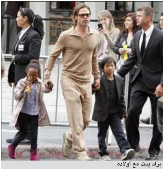
براد بيت مع اولاده

لوس أنجليس - يو.بي.أي: أكد النجم الهوليوودي براد بيت ان الأولوية في حياته لعائلته التي شددت على أنها كل شيء بالنسبة إليه.