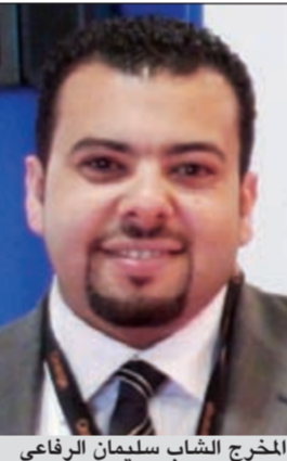
المخرج الشاب سليمان الرفاعي