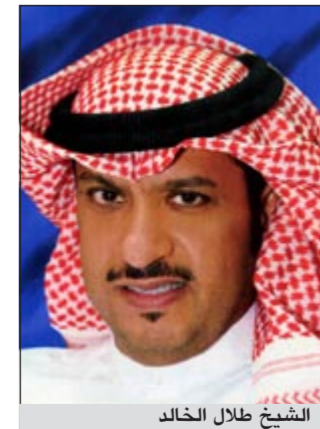
الشيخ طلال الخالد

الأحمد الصباح الذي يعتبر من أكثر الشخصيات اهتماماً بتنمية المجتمع لافتاً الى ان القطاعين الحكومي والخاص استطاعا استيعاب مسؤولية التنمية الملقاة على عاتقهما. وقال: «من أهداف المؤتمر تعريف الأزدحام المروري والنقاط السوداء بالأزدحام