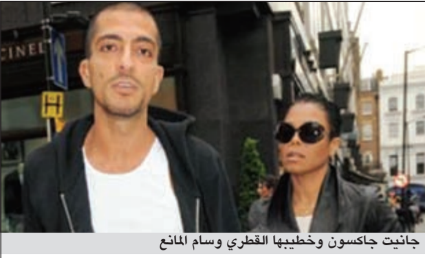
جانيت جاكسون وخطيبها القطري وسام المانع