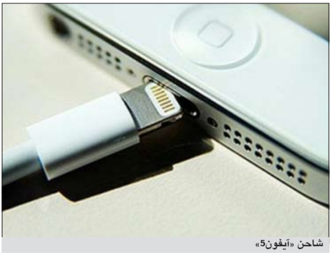
شاحن «آيفون 5»

وأشار التقرير إلى أن شركة آبل زودت شاحنها بخط دفاع ثالث والذي يتمثل بتزويد وصلة