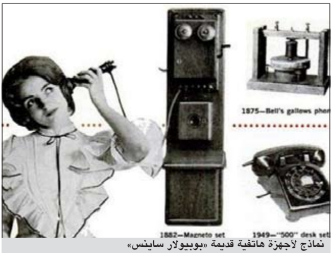
نماذج لأجهزة هاتفية قديمة «جوبيولار ساينس»

الهاتف السلكية، قائمة الاتصال (Contact List): هاتف يحفظ الأرقام من خلال بطاقة مثقبة تحمل رمزا خاصا بكل رقم. هاتف بمكبر للصوت (Speakerphone): يتيح إجراء محادثات جماعية بواسطة ميكروفون.