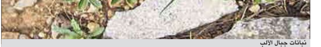
نباتات جبال الألب

باريس - أ.ش.أ: ذكرت دراسة أجراها فريق من علماء البيئة برئاسة بيير تارليه بجامعة «جوزيف فورييه» في فرنسا أن الأبحاث المعملية أثبتت أن نبات جبال الألب الواقعة على الحدود بين فرنسا وإيطاليا هي الأكثر غنى من حيث التنوع البيولوجي، خاصة أنها تعيش على ارتفاع يبلغ حوالي 1500 متر.