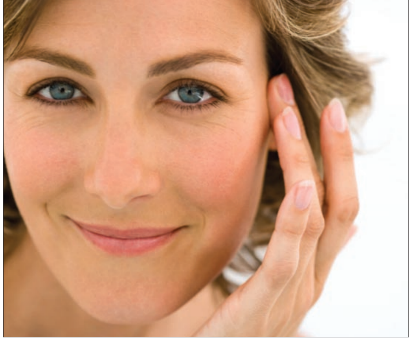
التفسير الكيميائي يكون للوجه واليدين

● بعد البلوغ يمر الشاب بمرحلة تغير في الهرمونات ويتضخم الصدر قليلاً، وهذا شيء عادي، ولكن المشكلة عندما يتضخم الصدر فربما تكون الغدة لديه كبيرة أو ان لديه زيادة في الوزن أو زيادة في الشحم، فقيل ان يتجه الى عمليات التجميل عليه إجراء تحاليل وعمل أشعات فإذا لم تكن لديه مشاكل جسدية يقوم بإجراء العملية وتكون بإزالة الغدة اذا كانت كبيرة بالشفط، أو قد تجري عملية صغيرة لإزالة هذه الغدة في الوقت نفسه، ونعطي الشكل العادي للصدر بحيث لا يكون شكلاً أنثوياً، لأنه قد يؤثر في نفسية الرجل.