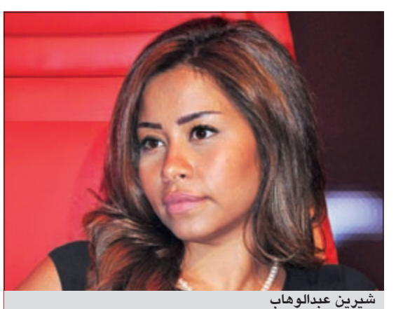
شيرين عبد الوهاب