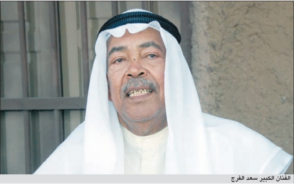
الفنان الكبير سعد الفرج

بعد تقديمه لأعمال تراجيدية لعامين متتاليين في شهر رمضان كشف الفنان الكبير سعد الفرج عن استعداده لتقديم عمل كوميدي في رمضان 2013، قائلا في تصريح له الأثناء: «لدي نص جديد ومختلف سيشكل عودة لي للمسلسلات الكوميدية، خصوصا أن المشاهدين في حاجة إلى مثل هذه الأعمال في ظل ما يشهده العالم العربي من توترات ومناظر مأساوية كل يوم، رفضا الإفصاح عن التفاصيل إلا بعد الاستقرار النهائي على العمل».