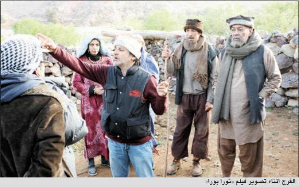
الفرج أثناء تصوير فيلم «تورا بورا»

الجدير بالذكر أن الفنان الكبير سعد الفرج كان من أبرز النجوم في رمضان 2011 الذين قدموا أعمالاً تراجيدية من خلال تصديه لبطولة