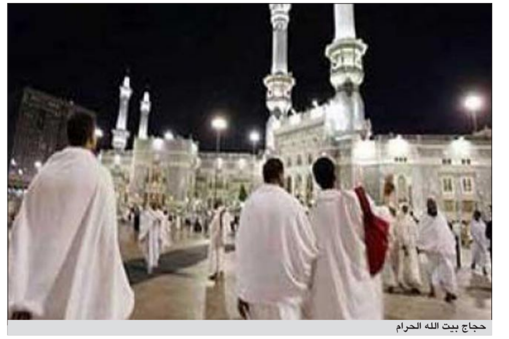
حجاج بيت الله الحرام

دمشق - أ.ش.أ: تعرض عريس سوري من محافظة القنيطرة للعقر من كلب ضال ليلة زفافه. وذكرت مصادر إعلامية سورية أنه أثناء قيام العريس بإغلاق ستائر غرفة نومه عقب عودته وعروسه التي ينهها ليلة الزفاف هجم عليه كلب ضال يعقره في إيته اليسرى. والأثاث أن العريس يسكن في الطابق الثالث والأخير وهذا يعني أن الكلاب بدأت تدخل البيوت والأبنية في المحافظة مما يشكل تهديدا حقيقيا للسكان والأطفال على وجه الخصوص، إضافة إلى ذلك فقد أكد أهالي العريس أنهم لم يتمكنوا من إخراج المصاب إلا من الحافلة لعدم قدرتهم على الدخول إلى البناية وطرد الكلب الضال. يذكر أن مشكلة الكلاب الضالة تتفاقم يوما بعد آخر في محافظة القنيطرة فخلال ثلاثة أيام فقط تم تسجيل 20 حالة فيما بلغ عدد المعضوضين 64 حالة خلال شهر سبتمبر الماضي في المحافظة.