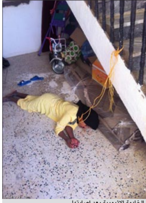
الخادمة الإثيوبية بعد إصابها

الرياض - وكالات: نجت خادمة إثيوبية من الموت بعد محاولتها الانتحار عقب تلقيها خبر وفاة ابنتها دهسا في بلادها ما دفعها لربط عنقها في سلم الدرج ورمي جسمها لاسفل إلا أن المسافة كانت قريبة وبالتالي كانت إصابها بسيطة وقد جرى نقلها للمستشفى لتلقي العلاجات الأولية، يذكر أن هذه الخادمة لم يمض على استفادها أكثر من شهرين، فيما أكد المتحدث الرسمي للشؤون الصحية بالطائف سراج الحميداني أن حالة الخادمة مستقرة، وأكدت إدارة مستشفى الخزعة أنه سيتم عرضها على طبيب نفسي.