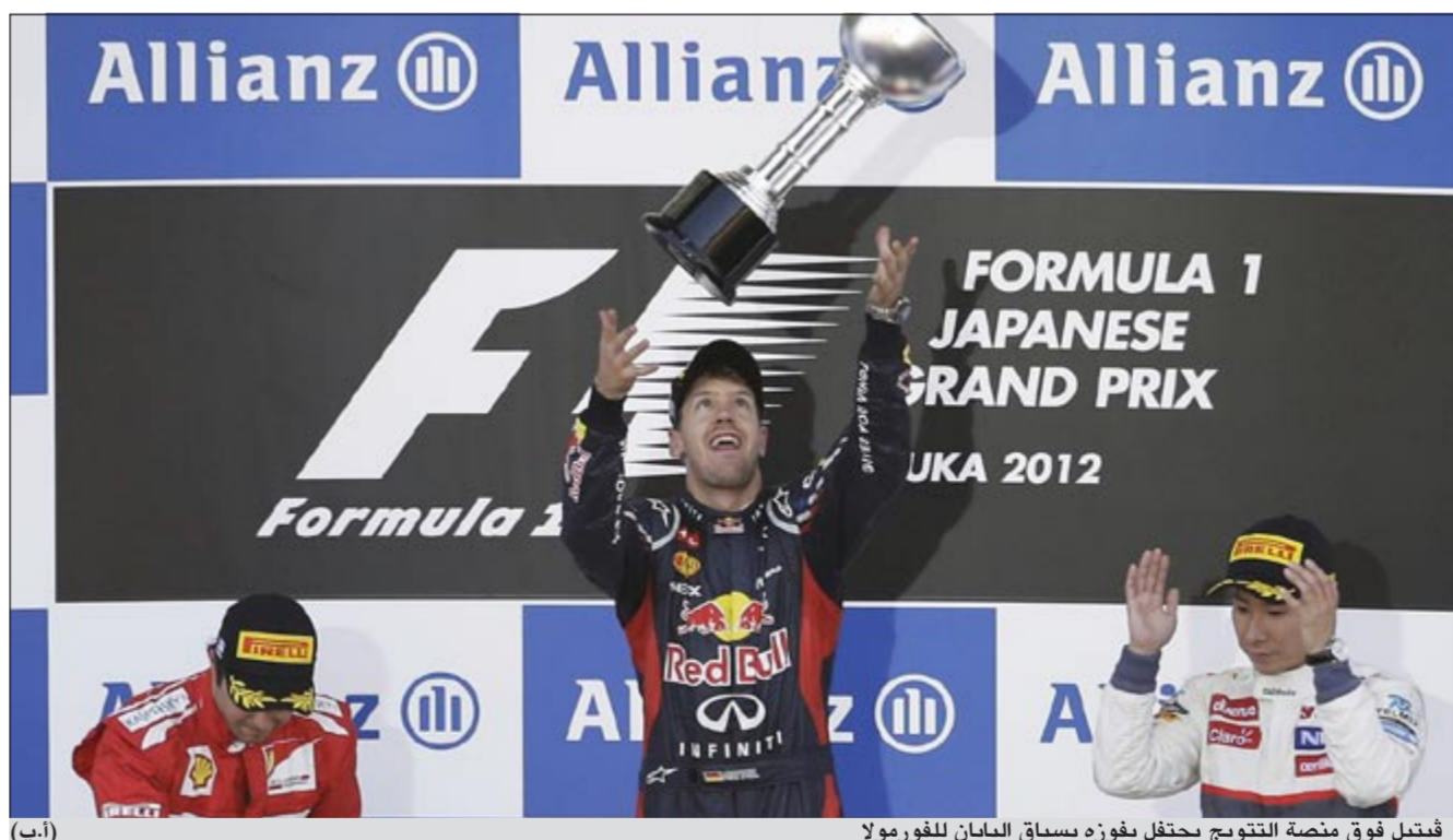
فيتيل فوق منصة التتويج يحتفل بفوزه بسباق اليابان للفورمولا