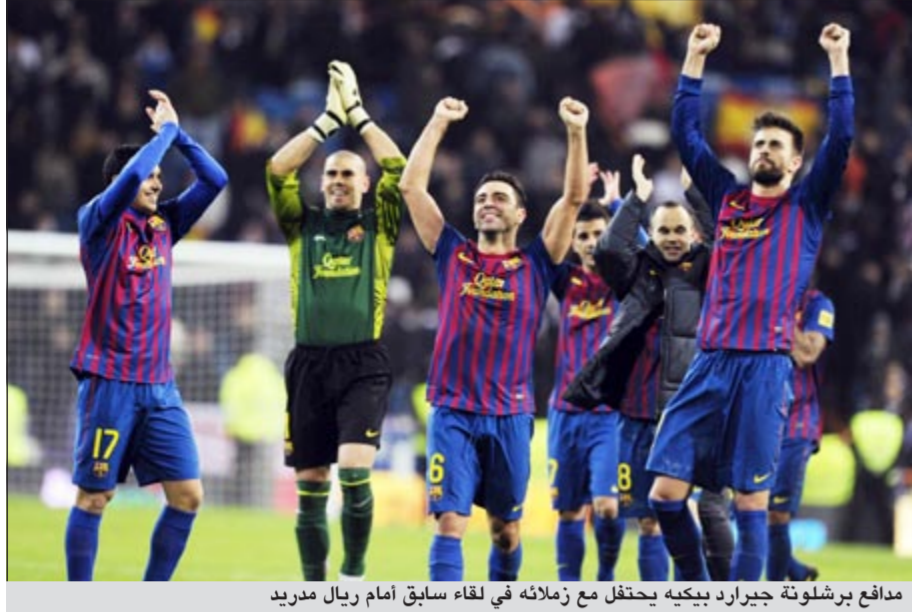
مدافع برشلونة جيرارد بيكيه يحتفل مع زملائه في لقاء سابق أمام ريال مدريد

انتقد مدافع برشلونة الإسباني جيرارد بيكيه ريسط مواجهة فريقه وريال مدريد في لقاء القمة (الكلاسيكو) في الدوري الإسباني لكرة القدم والتي أقيمت مساء أمس الأحد بالصراع السياسي الدائر بين إقليم كتالونيا وإسبانيا. واستعان بيكيه بصفحته بموقع «تويتر» للتواصل الاجتماعي عبر الإنترنت ليوضح حقيقة بعض التصريحات التي نشرتها مجلة «سبورتس إيلستريتد» والتي عقد فيها مقابلة بين الكلاسيكو والصراع بين إسبانيا وكاتالونيا. وقال بيكيه «قلت فقط إن المباراة بين برشلونة وريال مدريد ترتبط بشكل أكبر في كل مواجهة بين الفريقين بالصراع الكاتالوني - الإسباني وأنه يجب ألا يكون الأمر هكذا.. إنها مجرد مباراة في كرة القدم»، ونشرت «سبورتس إيلستريتد» قبل أيام تقريرا يتضمن تحليل لاعبي برشلونة لمباراة الكلاسيكو المرتقبة. وأوضح التقرير تصريحات بيكيه التي قال فيها «المباراة قوية للغاية وذلك ليس للدواع الرياضية فقط. هناك عامل سياسي أيضا الصراع أصبح بين كاتالونيا وإسبانيا أيضا وليس بين برشلونة وريال مدريد فقط». وقال بيكيه في تصريحاته بالتقرير أيضا «في النهاية، الأمر مبالغ فيه. أرى أن جميعنا يجب أن نهدأ قليلا». وجاءت المباراة وسط أجواء مشحونة في إسبانيا بسبب المظاهرات الحاشدة التي اندلعت بإقليم كتالونيا الشهر المقبل للمطالبة بانفصال واستقلال إقليم كتالونيا عن إسبانيا.