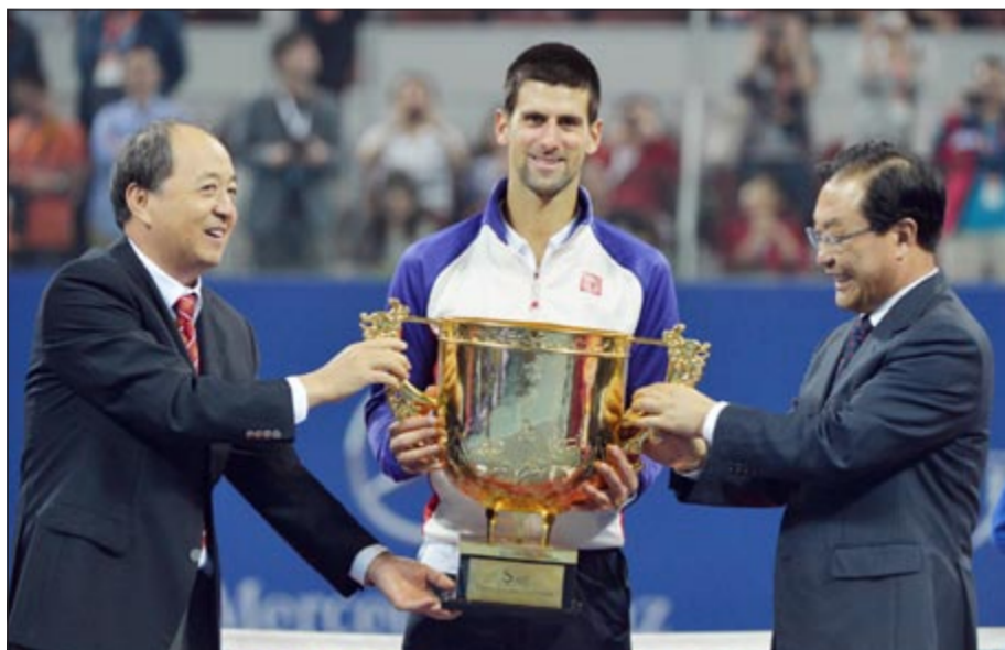
ديوكوفيتش يتسلم كأس بطولة بكين للتنس

احترافية حتى الآن، من بينها خمسة ألقاب كبيرة في الغراند سلام، التقى اللاعبان 13 مرة، ففاز الصربي 8 مرات منها 4 هذا العام في ربع النهائي دورات روما ورولان غاروس ودورة الألعاب الأولمبية في لندن، واليوم في نهائي بكين، فيما فاز الفرنسي 5 مرات آخرها في دورة باريس العام الماضي. وفي دورة طوكيو الدولية التي أحرز الياباني كي نيشيكوري المصنف ثامنا اللقب بفوزه على الكندي ميلوش راونيتش.