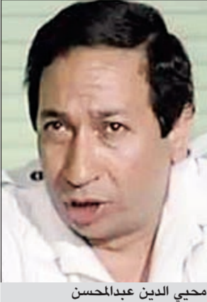
محيي الدين عبدالمحسن

القاهرة: تعرض الفنان الكبير محيي الدين عبدالمحسن لهُزلة صحية حادة تسم نقله على أثرها لمستشفى العجوزة. مصادر طبية أفادت بأن صحة الفنان الكبير تدهورت بصورة سيئة جدا، حيث إنه يعاني من مرض «الكانسسر».