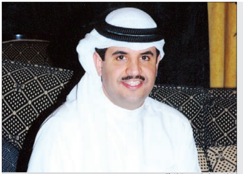
الشاعر الشيخ دعيج الخليفة