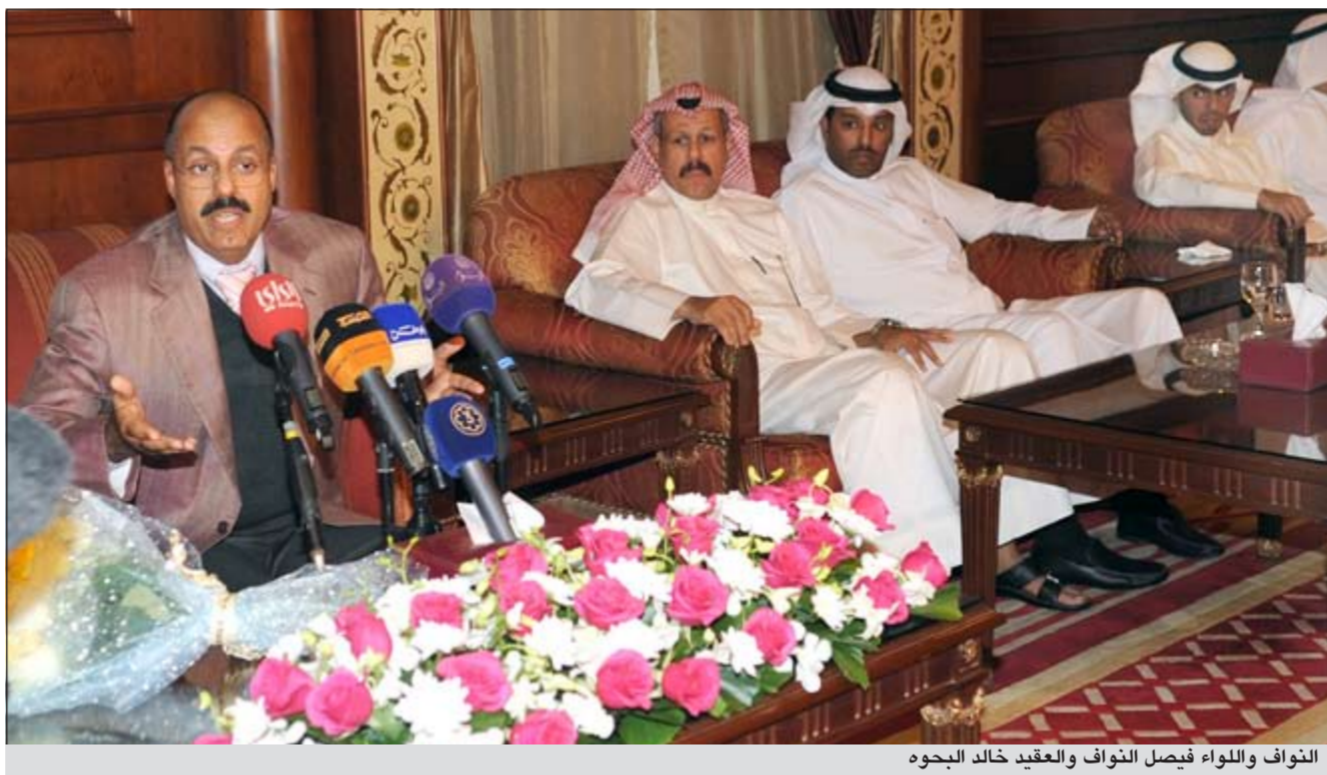
النواف واللواء فيصل النواف والعقيد خالد الجوه

عبدالله البرونزية الرابعة لشرطة الكويت في وزن 81 كغم. واختتمت البطولة بحضور رئيس الاتحادين الدولي والكويتي للشرطة الفريق الشيخ احمد النواف، ووزير الداخلية الروسي، كما حضر الختام الأمين العام للاتحاد الدولي للشرطة ساندر دبريكس، وأمين صندوق الاتحاد الدولي العقيد عبدالرحمن الحقان، ومستشار الاتحاد الدولي ولید الصانع ومدير المكتب الرئاسي الأمين العام المساعد المقدم خالد النجار، ورئيس العلاقات العامة والبروتوكول في الاتحاد الدولي الرائد طارق السدائي، بالإضافة إلى رؤساء الوفود المشاركة في البطولة. فخر لشرطة الكويت من جانبه أكد الفريق الشيخ احمد النواف أن حصول لاعبيننا على أربع ميداليات برونزية في ظل هذه المنافسة الكبيرة من أبطال دوليين في رياضة الجودو يعد مفخرة لنا كاتحاد دولي بصفة عامة ولوزارة الداخلية واتحاد الشرطة الكويتي على وجه الخصوص. وأشار إلى أن المستوى الفني المرتفع الذي واكب المباريات بين أبطال العالم من روسيا وهنغاريا