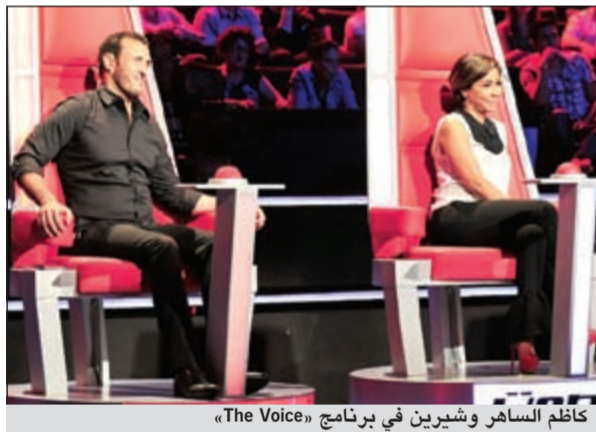
كاظم الساهر وشيخه في برنامج «The Voice»

بأن الساهر يجامله بسبب علاقة الصداقة التي تجمعهم بوالده.