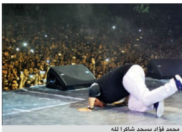
محمد فؤاد يسجد شاكرًا لله

«الحب الحقيقي». وقد تفاعل الجمهور مع أغنيات فؤاد وظل يرددوا معه.