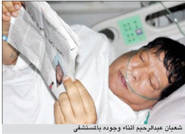
شعبان عبد الرحيم أثناء وجوده بالمستشفى

أكد المطرب الشعبي شعبان عبد الرحيم أنه غادر غرفة العناية المركزة والمستشفى الذي كان يدخله الخميس الماضي عقب إصابته بإزمة صحية، حيث يعاني من وجود مياه على الرئة. وصرح شعبان، بحسب «اليوم السابع» المصرية، بأنه يجلس حاليا في المنزل، وسليم تماما، وأن تلك الإزمة الصحية تصببه أحيانا فجأة وقال: «سأتوقف عن التدخين الذي سبب لي هذه الإزمة.. «أنا حرمت»».