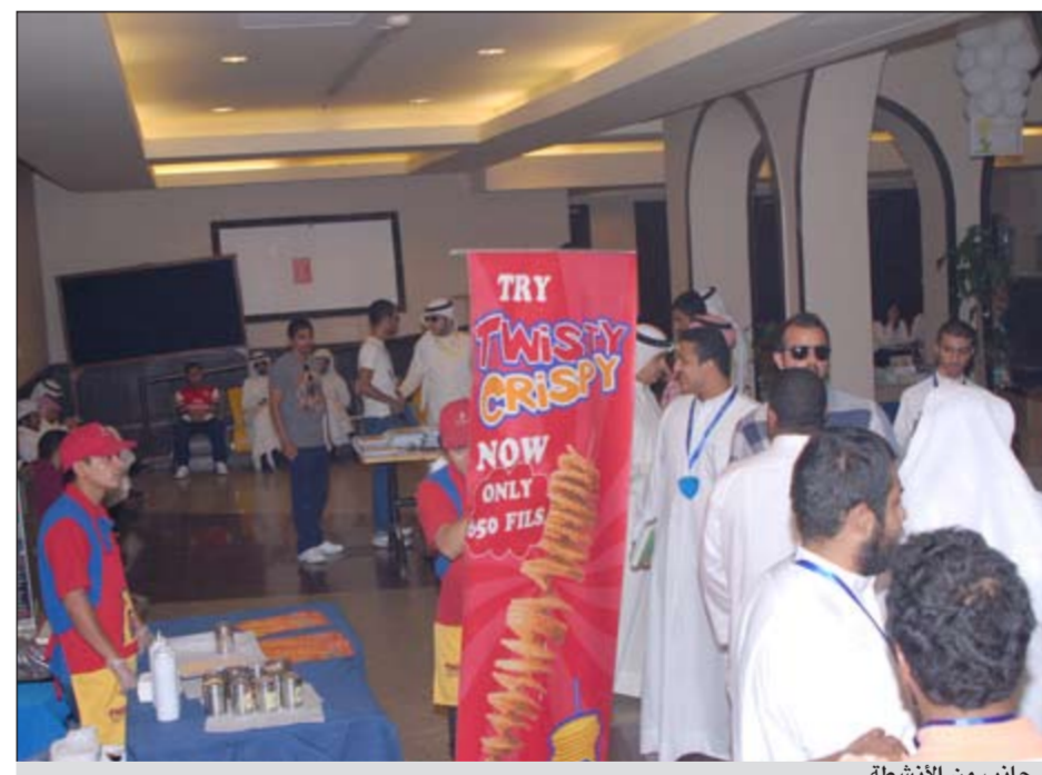
جانب من الأنشطة