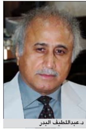
د.عبد اللطيف الجبر

أصدر مدير جامعة الكويت د.عبد اللطيف الجبر قراراً يقضي بتعديل مسمى مساعد نائب مدير الجامعة للأبحاث بالتعاون البحثي الخارجي ليصبح مساعد نائب مدير الجامعة للأبحاث بالتعاون البحثي الخارجي والاستشارات ويستمر الأستاذ د.عبد سرور العتيبي في شغل هذا المنصب الجديد حتى 2013/3/22. من جانب آخر أصدر مدير الجامعة قراراً يقضي في مادته الأولى: بالموافقة على قبول نقل ملكية وتبعية المختبر المركزي للتحاليل البيئية إلى جامعة الكويت دون مقابل بناء على مذكرة التفاهم وتنفيذاً لقرار مجلس الوزراء بتاريخ 2011/7/10، في شأن قبول نقل تبعية ملكية المختبر المركزي إلى جامعة الكويت وإحاطة مجلس الوزراء الموقر علماً بما تم. مادة 2: تعهدت كشوف حصر الأجهزة المتوفرة حالياً في المختبر المركزي والذي تم إعداده بتاريخ 2012/6/27. مادة 3: تتوكل عملية نقل