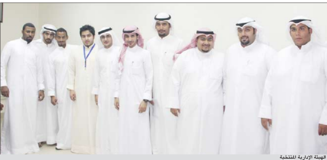
الهيئة الإدارية المنتخبة

أجهزة المختبر وتثبيتها كأصول ضمن ممتلكات جامعة الكويت إلى الأمانة العامة للجامعة وفقاً للإجراءات المتبعة في هذا الشأن. مادة 4: يمثل المختبر المركزي للتحاليل البيئية نواة لإنشاء وحدة وطنية تخصصية للأبحاث والخدمات البيئية في جامعة الكويت وتعتبر الوحدة جهة مستقلة تتبع إدارياً جامعة الكويت وليس لها تبعية لأي جهة أو مؤسسة أخرى. مادة 5: تحدد مهام الوحدة الوطنية التخصصية للأبحاث والخدمات البيئية بما يلي: أ - توفر الوحدة البنية التحتية والتسهيلات البحثية لخدمة الباحثين وطلبة الدراسات العليا في جامعة الكويت بالإضافة إلى تعزيز التعاون البحثي وتنفيذ أبحاث بيئية مشتركة مع الجهات البحثية المحلية والإقليمية والعالمية. ب - تقديم الوحدة المشورة للجهات المعنية بشؤون البيئة والمخططين وأصحاب القرار وتعمل على تدريب وتأهيل العمالة الوطنية في مجال التحاليل الكيميائية والبيئية. ج - تقديم الوحدة للخدمات المعنية بشؤون البيئة ويكون ذلك مقابل رسوم محددة تغطي التكلفة الفعلية للتشغيل على الأقل. د - تعطي جامعة الكويت مشاريع مستقلة تتبع إدارياً جامعة الكويت وليس لها تبعية لأي جهة أو مؤسسة أخرى. مادة 6: تحدد مهام الوحدة الوطنية التخصصية للأبحاث والخدمات البيئية بما يلي: أ - توفر الوحدة البنية التحتية والتسهيلات البحثية لخدمة الباحثين وطلبة الدراسات العليا في جامعة الكويت بالإضافة إلى تعزيز التعاون البحثي وتنفيذ أبحاث بيئية مشتركة مع الجهات البحثية المحلية والإقليمية والعالمية. ب - تقديم الوحدة المشورة للجهات المعنية بشؤون البيئة والمخططين وأصحاب القرار ز - ضرورة الحصول على شهادة «الاعتماد الدولي ايزو 15001» والحفاظ على استمراريتها.