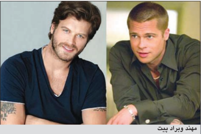
مهند وبراد بيت

وكالات: يحظى النجم الأميركي الشهير براد بيت بشعبية استثنائية في تركيا، فحزت العديد من شركات الإنتاج التركية الكبرى على عرض أدوار بطولة عليه، وحتى حلوله كضيف شرف في عمل درامي، إلا ان المفاوضات مع النجم غالبا ما كانت تتوقف قبل الوصول الى اتفاق. أما أشهر عرض قدم لبراد بيت، فهو تجسيد شخصية الملك «لايوش» في الموسم الثاني من مسلسل «حريم السلطان»، وقد اعتذر بيت عن الدور برغم عرض مبلغ مليوني دولار عليه، كما عرض على براد ان يصور أفلامه الأميركية في اسطنبول لحزبه الى السوق التركية، لكنه رفض هذا العرض أيضا. وأخيرا، بدأ الإعلام التركي «بتداول خبر موافقة أولية لبراد بيت على تقديم مسلسل درامي تركي» مع النجم الأشهر كيفانج