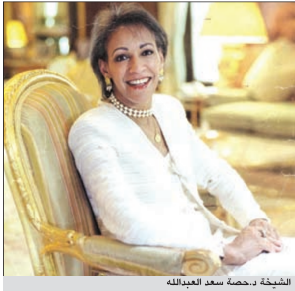
الشيخة د.حصة سعد العبدالله

وأشارت إلى أن ضلوع السيدات العربيات بمسؤوليات مباشرة في الغرفة التجارية الإيطالية العربية يعكس الدور الفاعل والمتنامي للمرأة العربية وإسهامها المهم في النهوض بهذه المشروعات عبر التواصل المتحرر مع نظيراتها الإيطالية للاستفادة من الفرص الكبيرة للتبادل التجاري والتقني مع