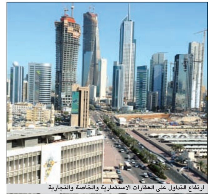
ارتفاع التداول على العقارات الاستثمارية والخاصة والتجارية

أظهرت إحصاءات إدارتي التسجيل العقاري والتوثيق في وزارة العدل خلال الفترة من 26 إلى 30 أغسطس الماضي أن هناك ارتفاعا في تداول العقارات مقارنة بالفترة من 23 إلى 26 أغسطس الماضي حيث أظهرت الإحصاءات أن عدد العقارات المتداولة للعقود بالنسبة للعقار الخاص بلغ 48 عقارا بمبلغ قدره 9,9 ملايين دينار، في حين بلغ عدد العقارات الاستثمارية 7 عقارات بقيمة 3,5 ملايين دينار وبلغ عدد العقار التجاري عقارا واحدا بقيمة 1,7 مليون دينار ولم يشهد عقارات المخازن أو الحرقي أو الشريط الساحلي أي تحرك خلال هذه الفترة.