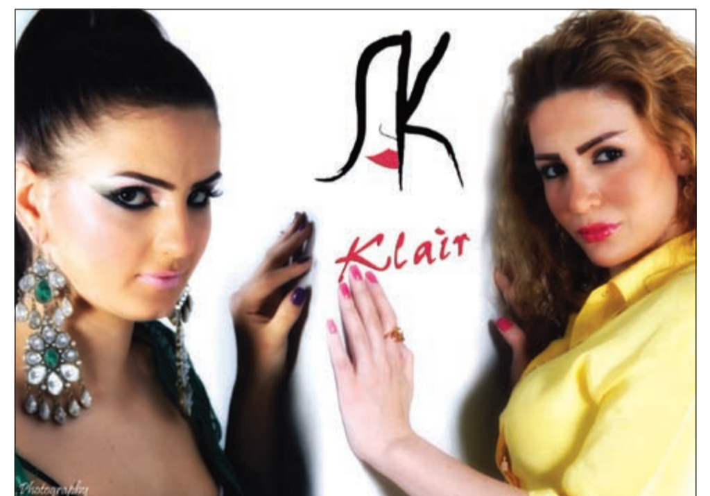
«كلير»، ونصائح للتزيين على عرش الجمال

الحديث عن الحكومة المنتخبة، إضافة الى كونه حديثاً لا يستقيم والدستور الكويتي، هو حديث مضر وكريه ولعبة قمار من شأنها أن تصيب عصب الوحدة الوطنية، وربما يكون الهدف منه تهريب الربيع العربي الى الكويت، بعد أن فتحت الانتخابات في تونس ومصر شهية البعض حتى صار يخلط ما بين حماية الدستور والانقراض عليه. الشرعية التاريخية والاجتماعية التي تمتلكها الأسر الحاكمة سواء في الكويت أو في سائر الدول الخليجية جعلت منها قاسماً مشتركاً بين الناس الذين هم بطبيعتهم مختلفون اجتماعياً وسياسياً واقتصادياً ومذهبياً. هذا القاسم المشترك جعل من الأسر الحاكمة بوابة للعموم بعبورها جميع أولئك الناس المختلفين سواء قدموا من الشرق أو الغرب أو الشمال أو الجنوب. هذه الخصوصية جعلت من بيت الحكم هو المسؤول الأمين الوحيد والحصري عن تشكيل الحكومات وكل من ينازعه الحق يسهم (بوعي أو دون وعي) في دفع البلاد الى الهلاك المحتوم. فالحكومة سلطة تنفيذ تفسر قراراتها المصلحة العليا للبلاد ومصالح الناس وأمنهم ومستقبلهم وليس من الحكمة التفريط في هذه المصالح والأمن والمستقبل تحت وهم الإصلاح السياسي الذي يمكن تحقيقه دون القفز نحو المجهول.