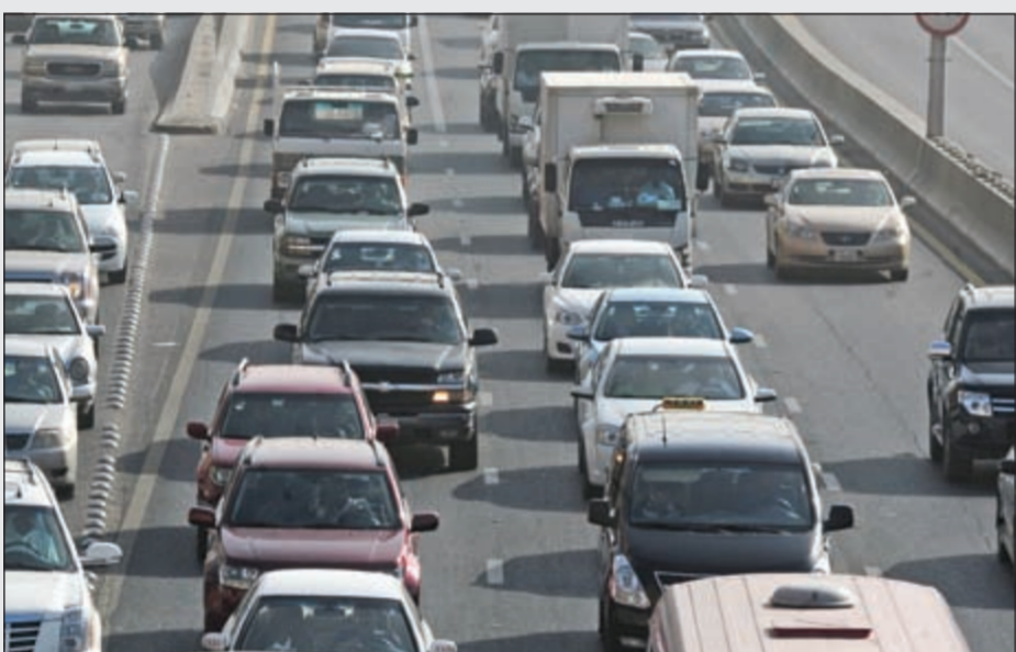
زحام مستمر.. لكن الأحد الأقفر ازدياداً (هاني عبدالله)

يوم الأحد دون سائر الأيام هو الأكثر ازدياداً مروراً بين أيام العمل العادية، فيوم الاثنين وحتى الأربعاء أقل ازدياداً منه بمقدار النصف وكذلك بقية أيام العمل الرسمية، بل وازدياداً كما يصفه البعض يساوي ازدياداً 3 أيام متصلة، فما السر وراء كون أول يوم في الأسبوع هو الأكثر ازدياداً وبشكل ملاحظ؟ «البطالة المقنعة» هي السبب الرئيسي وراء ازدياد يوم الأحد، بل والسر الوحيد لكون هذا اليوم تحديداً يشهد اختناقات مرورية لا يشهدها أي يوم آخر، وهو ما يكشفه قيادي في إحدى الوزارات قائلاً: «يشهد هذا اليوم تحديداً دون غيره من بين أيام الأسبوع حضور جميع موظفي القطاع دون استثناء سواء العاملون الحقيقيون أو الموظفين بالاسم فقط»، ويشرح مصطلح موظفين بالاسم قائلاً: «هم الموظفون الذين لا يحضرون الا يوماً واحداً في الأسبوع من أجل توقيع كشف حضور الأسبوع كاملاً، من الأحد وحتى الخميس، كتوع من أثبات حضورهم، بمعنى انهم غير ملزمين بالحضور سوى هذا اليوم فقط ذلك لأنهم غير مدرجين ضمن الهيكلية الخاصة بالقطاع ولا يوجد لهم أي دور، بل ان حضورهم أحياناً قد يترك العمل ولا وجود لمكاتبات لهم، فيضطر مسؤول القطاع الى منحهم اجازة». وحول عدد الموظفين بالاسم في قطاعه قال: «يقترّب من 100 موظف بالاسم، وهناك قطاعات يوجد