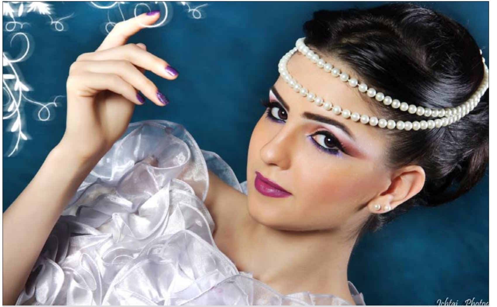
نيولوك بعيداً عن مشرط الجراح

وأضافت «إن هناك الكثير من الأمور التجميلية التي يتقنها الخبراء لعمل «لون» جديد مختلف تماماً عما يسبقه، والذي نستعين في تنفيذه بالتحكم في كافة المستحضرات التي نستخدمها مثل مسحوق الشوائب الذي يخفي عيوب البشرة من هالات سوداء أو تصبغات جلدية، و«فون دوتان» أو كريم الأساس