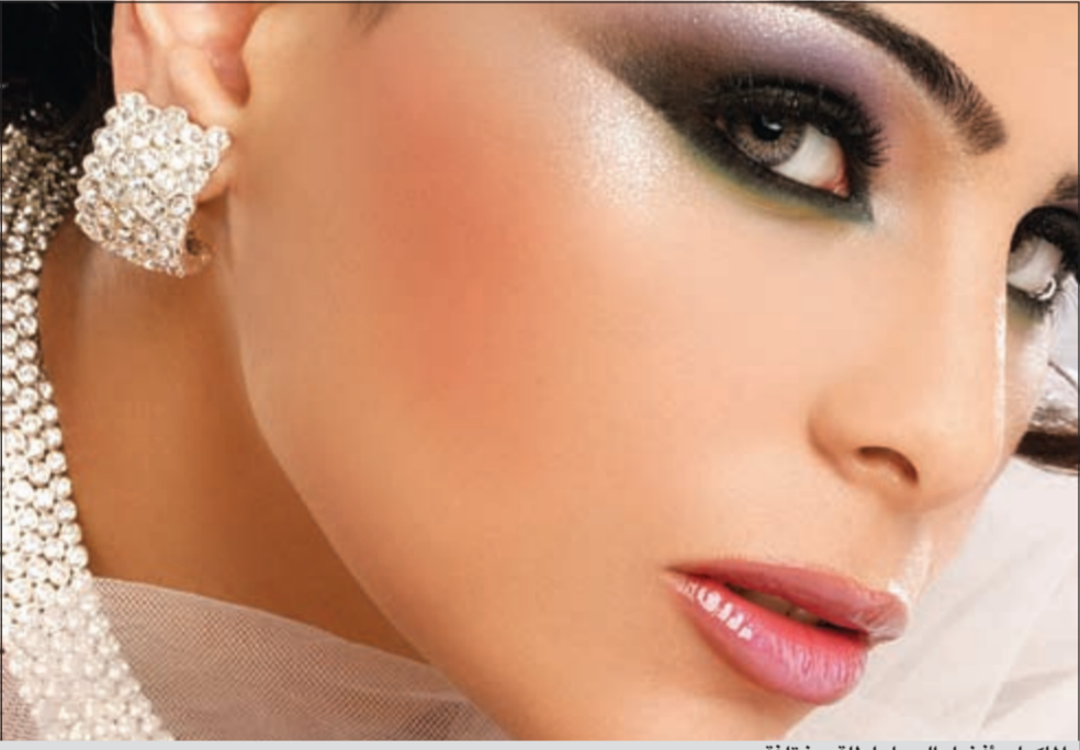
المكياج أفضل السبل لطلعة مختلفة

«الشادو».. «الظلال».. «قلم الكحل» آليات تصحيح عيوب العين والتحكم في إظهارها وإعطائها مظهراً جذاباً