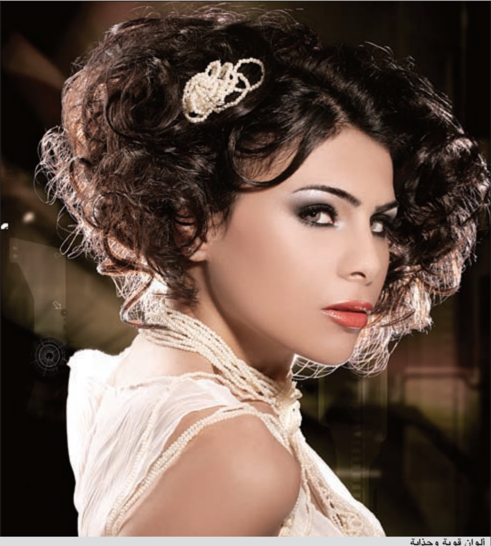
ألوان قوية وجذابة