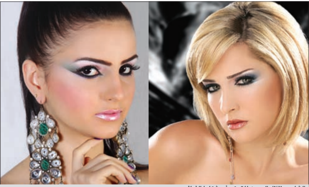
الشادو وظلال العيون للتحكم في شكلها النهائي

الألوان عالم واسع عليك الإلمام بأنواعها أساسية وتأنوية.. باردة ودافئة ولأفضل النتائج احذري دمج الألوان المكتملة