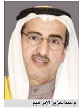
م. عبدالعزیز الإبراهيم

أكد وزير الكهرباء والماء ووزير الدولة لشؤون البلدية م.عبدالعزيز الإبراهيم أن البلدية تتعامل مع المجلس البلدي وفقاً للقانون 2005/5 مستندة بضرورة أن يسود الاحترام المتبادل لتحقيق المصلحة العامة للوطن والمواطنين. وقال الإبراهيم في بيان صحافي رداً على تصريحات بعض أعضاء المجلس البلدي خلال جلسته الماضية التي عقدت في الأول من أكتوبر الجاري: بناء على ما تناقلته الصحف المحلية لجلسة المجلس البلدي وما تخللها من توجيه الاتهامات بضعف أداء بعض أعضاء المجلس لبلدية ومديريها العام وعدد من قياداتها وكان الأذى بهم الترفع عنها في مثل هذه المحافل، حيث إن اعتراضه تم وفقاً لألية واضحة ومحددة واستناداً إلى التقارير والمستندات المرفقة من الجهات الحكومية والتي سيتم بيانها تباعاً على خلفية ما أثير خلال الجلسة التي خرج بعض أعضائها عن إطارها العام. وقد أوضح الإبراهيم في تصريح صحافي أن موافقة المجلس البلدي على اقتراح تسمية الشوارع بأسماء الأشخاص تعتبر من القرارات الحكومية بنص المادة 12 من القانون (5 لسنة 2005) بشأن بلدية الكويت التي تتطلب لصورها تقديم دراسة من الجهاز التنفيذي للبلدية، وإحفاقاً للحق ومن باب العدل والمساواة للجميع تم تشكيل لجنة من الجهاز التنفيذي لبلدية الكويت ومن جهات الاختصاص المعنية بالدولة ممثلة فيها الديوان الأميري ومجلس الوزراء والمجلس الوطني للثقافة والفنون والآداب وجهات أخرى تختص بدراسة أي طلب وفقاً للمعايير والضوابط التي تم