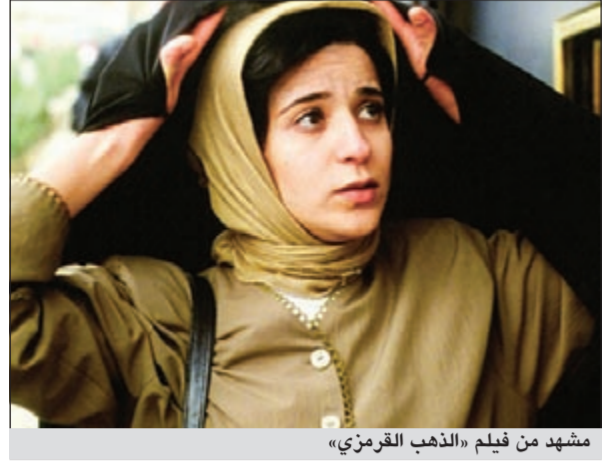
مشهد من فيلم «الذهب القرمزي»