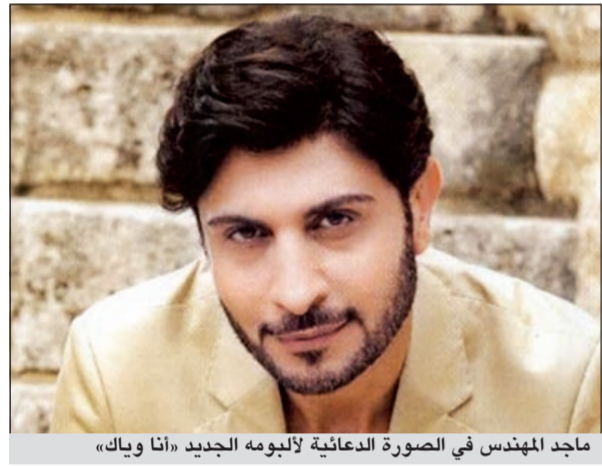
ماجد المهندس في الصورة الدعائية لألبومه الجديد «أنا ويك»

والمعروف عن المهندس الظهور بالوك الكلاسيكي إلا أنه تخلى عنه واستبدله بقصة شعر مستوحاة من الغرب، إضافة إلى ارتدائه الملابس الكاجوال. وانهالست التعليقات على الصور فمتهم من طالبه، بحسب موقع «جولولي»، بالرجوع لسابق إطلالاته حفاظا على هويته العربية، ومنهم من رأى أن التغيير سمة العصر