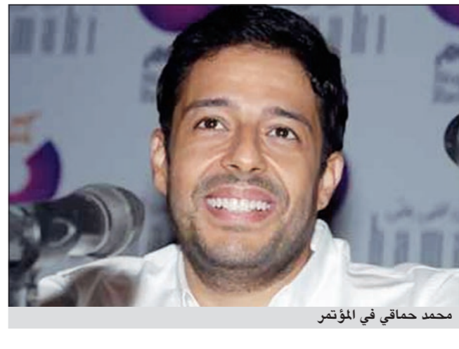
محمد حماقي في المؤتمر

يوجد بالنسخة الجديدة دعوة لحضور حفلات حماقي القادمة لمدة عام كامل، إذ تتيج لمحبي حماقي حضور حفلاته مجانا لمدة عام. أما المفاجأة الثانية فكشف حماقي أنه سوف يقوم بتصوير 3 كليبات من ألبومه الجديد أولا أغنية «نفسني أبقي جنبه» والتي كتب كلماتها الشاعر أيمن بهجت قمر وتوزيع توما، فضلا عن أنه سيقدم حفلا غنائيا ليكون حفله الأول بعد إطلاق الألبوم. وثالث مفاجأة أول تجهيزه لإعادة تقديم أغنية قديمة للفنان سمير الاسكندراني كان من المقرر