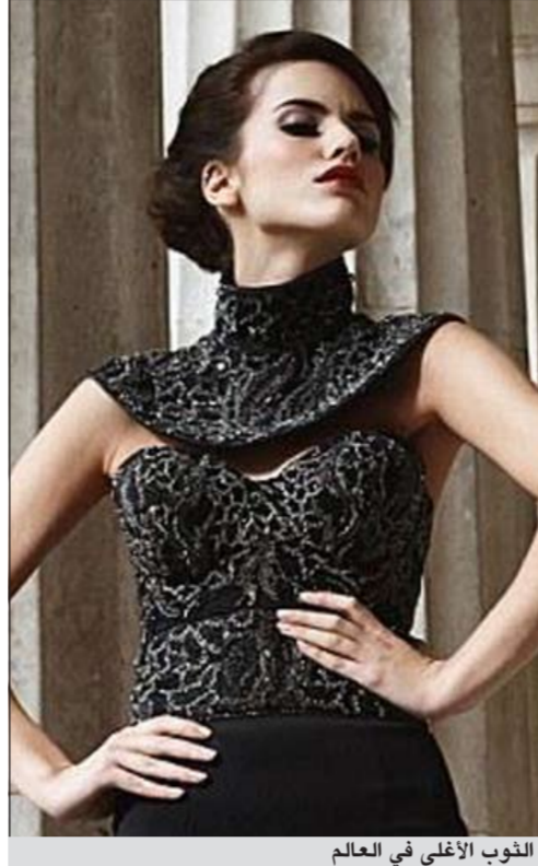
الثوب الأعلى في العالم