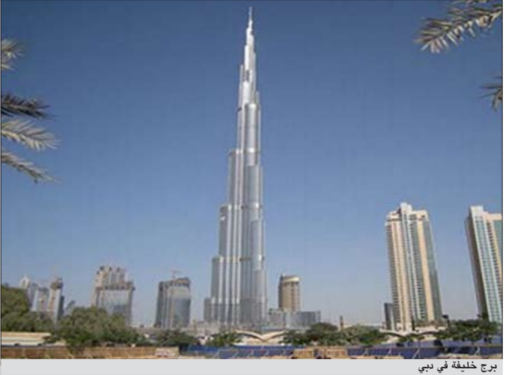
برج خليفة في دبي