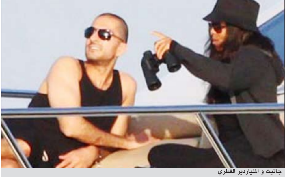
جانيت و الملياردير القطري

وصفت بأنها ستكون زواج القرن.. ويتوقع أن تبلغ تكاليف الزواج 20 مليون دولار من بينها 3 ملايين دولار تكاليف حضور المدعوين البالغ عددهم 500، فيما ينوي العريس اهداء ساعة روليكس بقيمة 10 آلاف دولار لكل مدعو. وتبلغ شقيقة نجم البوب الراحل من العمر 46 عاما بينما يبلغ عمر القطري 36 عاما.