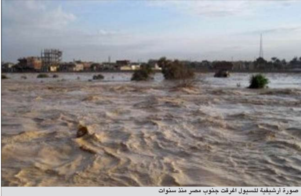
صورة أرشيفية للسيول اغرقت جنوب مصر منذ سنوات