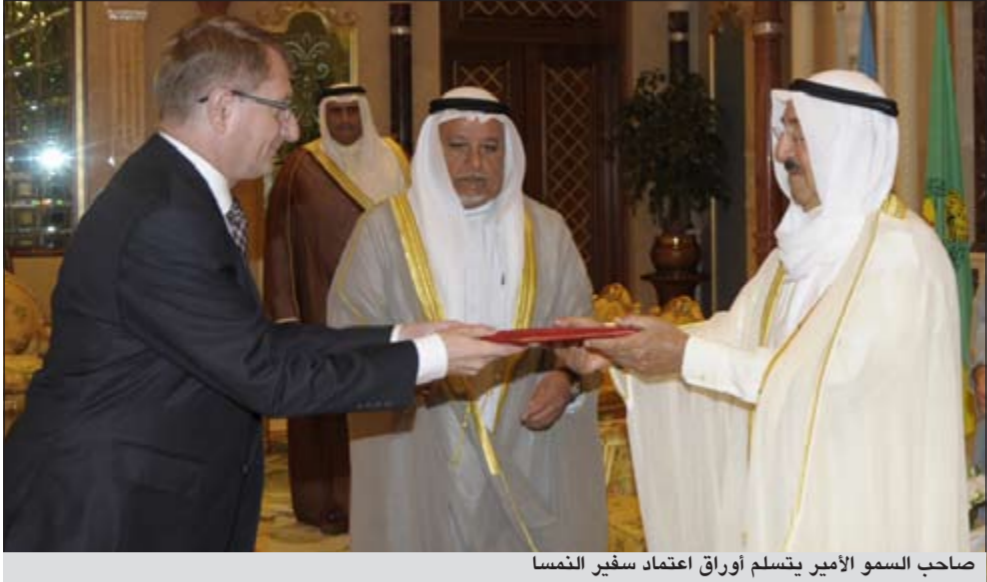
صاحب السمو الأمير يتسلم أوراق اعتماد سفير النمسا