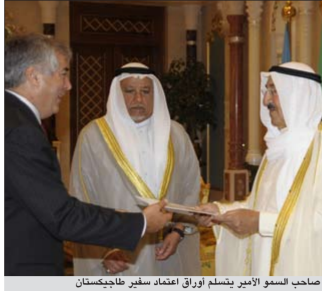
صاحب السمو الأمير يتسلم أوراق اعتماد سفير طاجيكستان