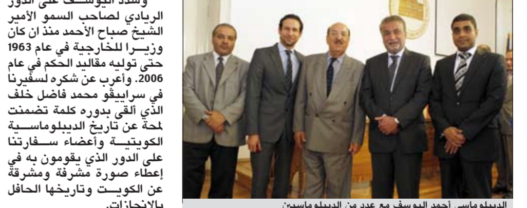
الدبلوماسي أحمد اليوسف مع عدد من الدبلوماسيين

سراييفو - كونا: أكد الدبلوماسي المخضرم أحمد غيث اليوسف أمس أن الدبلوماسية الكويتية نحت في الحفاظ على الاستقلالية وتوازن السياسة الخارجية ولم تتأثر بالحرب الباردة.