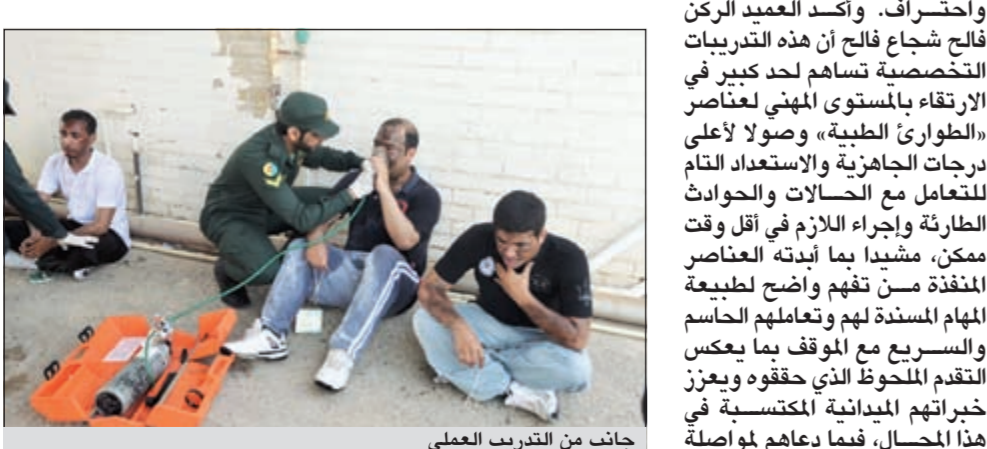
جانب من التدريب العملي

شهد قائد الإسناد بالحرس الوطني العميد الركن فالح شجاع فالح بياناً عملياً نفذته مديرية الخدمات الطبية ممثلة في ركن أول طوارئ طبية بالتعاون مع وحدة الإطفاء. استهدف قياس سرعة الاستجابة لدى عناصر الوحدة في التعامل مع الحوادث وإسعاف المصابين بسناريوهات مختلفة داخل منظومة التدريب، كما ركز البيان على تطوير أوجه الاتصال بين الوحدات كافة بما يراعي عامل الوقت في الحالات والموافق الطارئة.