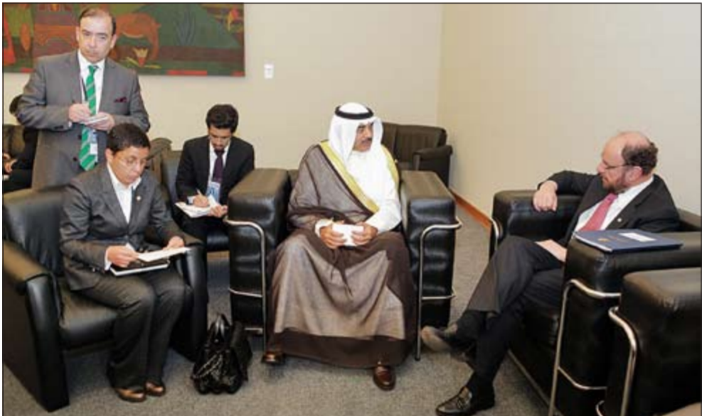
ممثل صاحب السمو الأمير خلال لقائه وزيراً خارجياً تشيلي

ممثل صاحب السمو الأمير التقى وزيراً خارجياً تشيلي والإكوادور