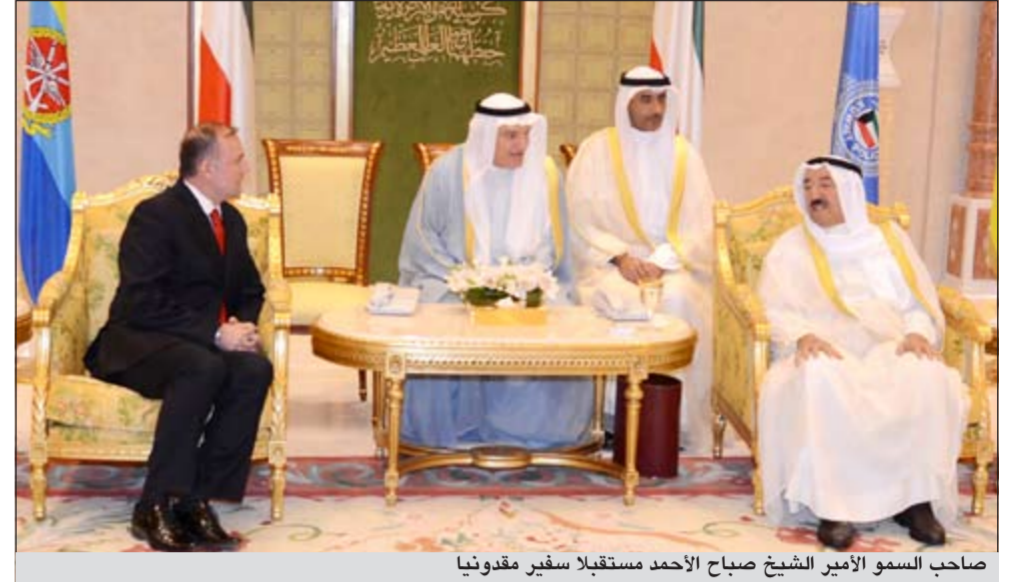
صاحب السمو الأمير الشيخ صباح الأحمد مستقبلاً سفير مقدونيا

الرئيس الفياض كوندري رئيس جمهورية غينيا الصديقة عبر فيها سموه عن خالص تهنأته بمناسبة العيد الوطني لبلاده، متمنياً له موفقاً الصحة والعافية. كما بعث سمو رئيس مجلس الوزراء الشيخ جابر المبارك ببرقية تهنئة مماثلة.