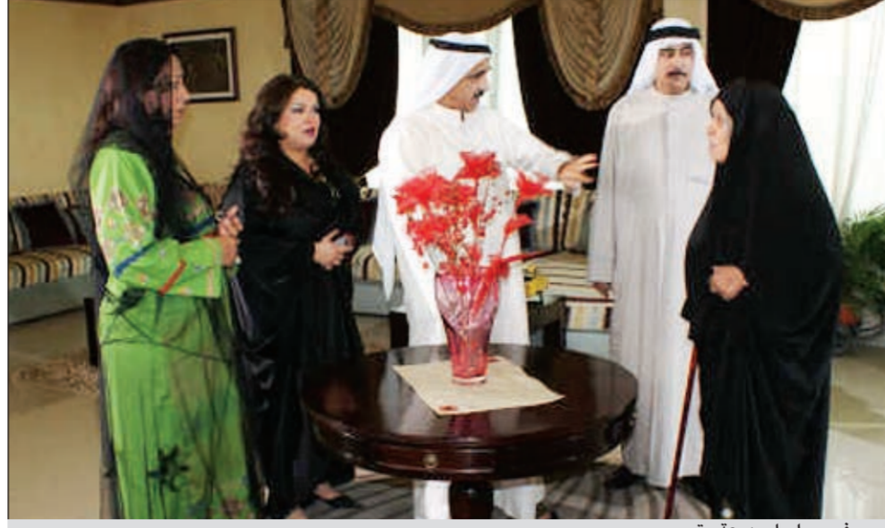
.. وفي مسلسل «دمعة يتيم»