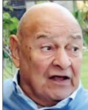
الفنان الراحل احمد رمزي

تداول رواد موقع التواصل الاجتماعي (فيسبوك) صورة غريبة للفنانة اللبنانية رولا سعد تبدو فيها بدون اي مكياج، وبدت رولا في الصورة مبتسمة وترتدي ملابس عادية، ويبدو انها لا تعلم ان الصورة ستكون منار جلد بين الجمهور الذي اعتاد ان يراها متوهجة بالمكياج والملابس المثيرة، وكالعادة لم تمر