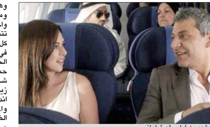
مشهد من فيلم «قصة ثواني»

تفتحت في السابعة من مساء غد الأربعاء في صالات سينما «إبراج» في فرن الشباك، الدورة الثانية عشرة من مهرجان بيروت الدولي للسينما، بالفيلم اللبناني «قصة ثواني» للمخرجة لارا سابا، الذي يتناول قضايا اجتماعية في المجتمع اللبناني، في إطار قصة ثلاث شخصيات في بيروت، تتقاطع أقدارها من دون أن تعرف أي منها الأخرى، وتتؤثر قرارات كل منها، من حيث لا تدري، في حياة الشخصيات الأخرى. وتنتمي الشخصيات في الفيلم إلى خلفيات اجتماعية مختلفة،