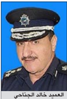
العميد خالد الجناحي

هنا طلاب مدرسة الشرطة على ثقة ووزارة الداخلية بهم، كما نصحهم بالحفاظ على شرف المهنة وخدمة الوطن في أي موقع، داعياً الطلاب المستجدين للاطلاع على دليل الطالب الذي تم توزيعه عليهم وذلك لما يحتويه من أهم الأحكام التي يجب الإلمام بها والرجوع إليها عند الحاجة.