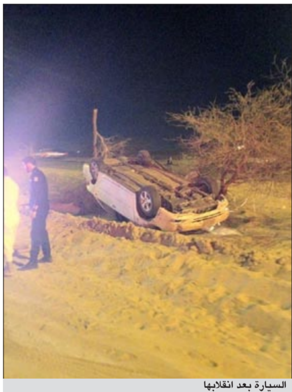
السيارة بعد انقلابها