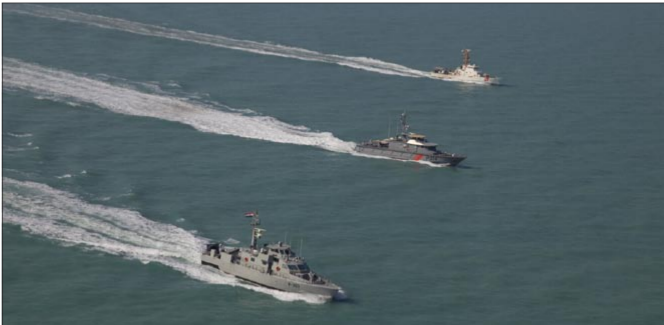
التمرين شارك فيه 30 دولة