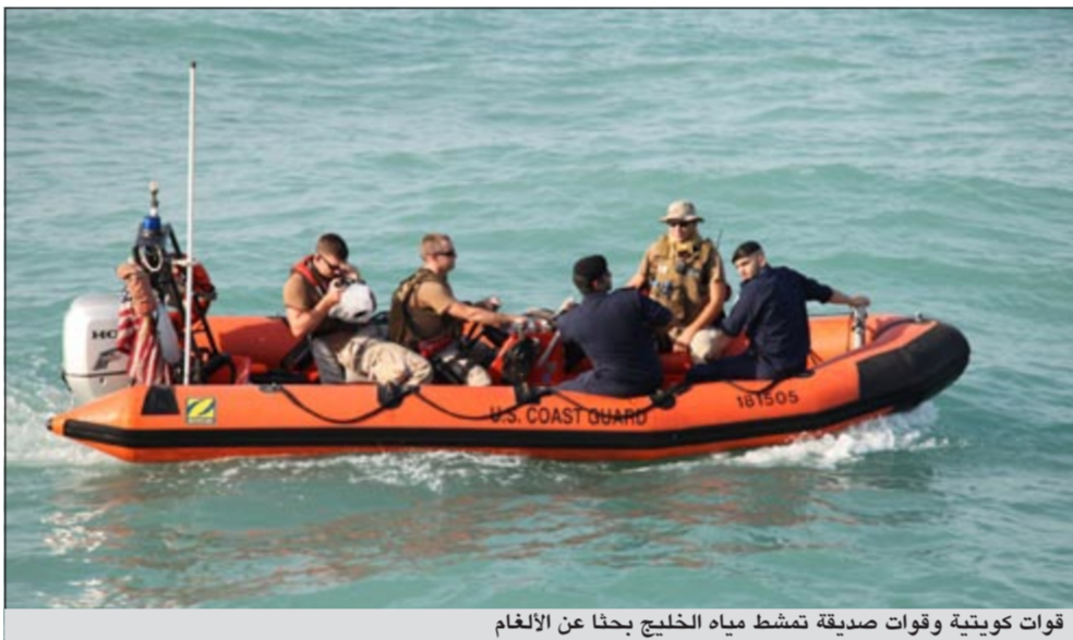
قوات كويتية وقوات صديقة تمشط مياه الخليج بحثا عن الألغام

لخفر السواحل ضمن التدريبات والتمارين المشتركة لاكتساب الخبرات وتبادل المعلومات لرجال خفر السواحل في مجالات الإقحام والتفتيش والبحث والإنقاذ والمطاردة البحرية.