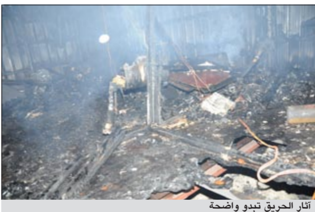
آثار الحريق تبدو واضحة

أوضحت الإدارة العامة للإطفاء حقيقة ما حدث في إحدى مدراس محافظة مبارك الكبير وقالت إدارة العلاقات العامة في بيان لها.. انه ورد بلاغ من مركز العمليات فجر الجمعة يفيد بحريق شاليه (شبرة) داخل إحدى المدارس في ضاحية صباح السالم فتوجهت فرقة اطفاء مركز القرين وعند وصول رجال الاطفاء الى موقع الحادث تبين ان الحريق في شاليه تابع لمشروع قيد الانشاء داخل المدرسة حيث قام رجال الاطفاء بتسكيل فرق محاصرة الحريق ومنع انتشاره