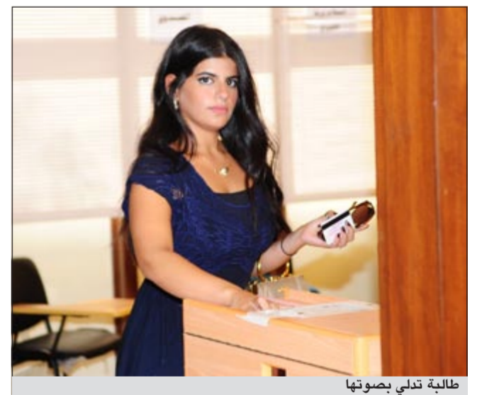
طالبة تدلي بصوتها