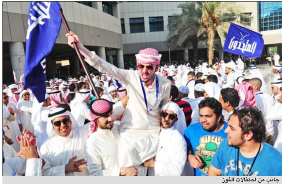
جانب من احتفالات الفوز