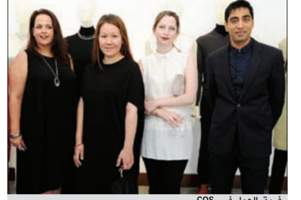
فريق العمل في «COS».

بعد انطلاقة مروسة حذرة ومؤثرة للعلامة في الأسواق الأوروبية أعلنت شركة COS عن تعاونها مع شركة محمد حمود الشايح لافتتاح أول محل لها في الكويت داخل مجمع الأفنيوز بحلول خريف 2012، جاء ذلك خلال مؤتمر صحفي عقد في FA Gallery حضره حشد من الصحفيين، تم فيه التعريف بشركة COS التي تعود بداية انطلاقتها إلى مارس 2007 حيث افتتحت العلامة أول بوتيك لها في شارع ريجنت وسط العاصمة البريطانية لندن، والعلامة تشكل جزءاً كاملاً لمجموعة H&M، إذ تبنت استراتيجيتها تسويقها على معايير الأناقة والجودة والأسعار الاقتصادية التنافسية ذاتها. تقدم COS تشكيلة أزياء عصرية مختارة أساسية وغيرها أبداعية وأخرى بتصاميم كلاسيكية يعاد ابتكارها فضلاً عن الأزياء بمواضيع تجسد أحدث توجهات وخطوط الأناقة العصرية للرجل والمرأة، تمتلك الشركة 53 بوتيكاً موزعة في أسواق كل من المملكة المتحدة وألمانيا وهولندا والدنمارك وفرنسا وإسبانيا وبلجيكا وإيرلندا والسويد وإيطاليا وفنلندا وبولندا وهونغ كونغ فضلاً عن تواجدها المتميز في 18 سوقاً أوروبية على الإنترنت «اون لاين». تزدهر COS بالأزياء الراقية بتصاميم عصرية أنيقة ذات جودة عالية وبأسعار تنافسية في متناول الجميع منذ بدء نشاط العلامة في 2007. كما دأبت COS على تهديد الطريق لتواجد مرموق في أسواق العالم وبلدان الشرق الأوسط وتتعدو دوراً رديفاً للأناقة والجودة والتميز.