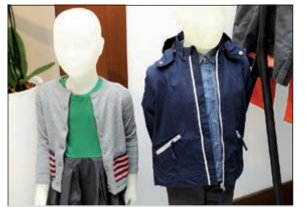
من ملابس الأطفال