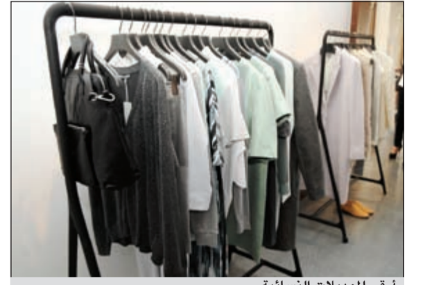
أزقي الموديلات النسائية