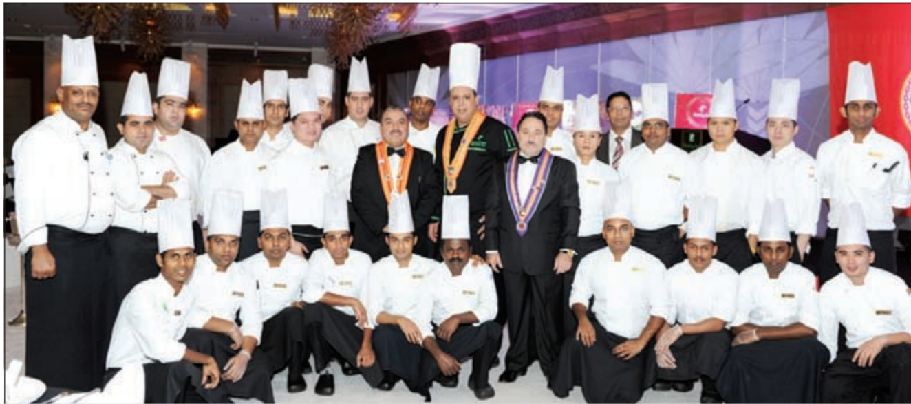
طهاة «هوليداي إن»... واستعداد لتجهيز أشهى المأكولات والأطباق

التذكارية، كما لقي المسؤول عن الجمعية كلمة شكر فيها فندق هوليداي إن والقائمين على العشاء. والجدير بالذكر أن فندق هوليداي إن يتميز بموقعه المميز الكائن في قلب منطقة السالمة على شارع الخليج بالقرب من المركز العلمي ومنطقة التسوق الشهيرة في السالمة بالإضافة إلى خدماته الفريدة وتنوع مطعمه التي تبرز تراث وتقاليد الضيافة لكل بلد،