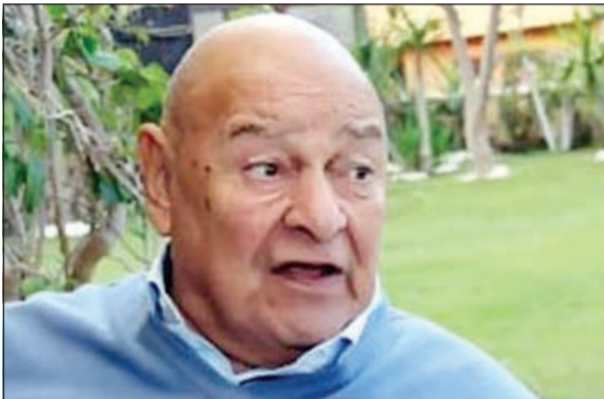
الفنان الكبير الراحل أحمد رمزي

ومن جانبها كشفت الفنانة نجوى فؤاد عن تفاصيل زواجها من الفنان الراحل أحمد رمزي، ووصفته بأنه كان مع وقف التنفيذ لأنه لم يدم سوى 17 يوماً فقط، مؤكدة أن رمزي كان واحداً من أكثر الشخصيات الذين يمكن أن تعتمد عليهم وتثق بهم خلال الأزمات المختلفة. وأضافت نجوى أن قصة ارتباطها بالفنان الراحل غريبة للغاية، فهو لم يكن يعرفها جيداً، وهي كذلك، ولكن بعد تعاونهما في فيلم «جواز في خطر» وكان لا يزال مع زوجته الأولى السيدة عطية وحصل انفصالهما خلال تصوير الفيلم، مما قرّبهما (هو ونجوى) من بعضهما مشيرة، بحسب «إيلاف»، إلى أن رمزي طلب الارتباط بها بعد انفصاله عن زوجته.