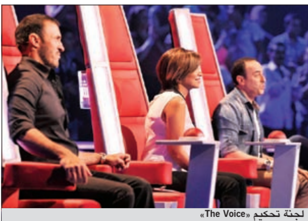
لجنة تحكيم «The Voice»