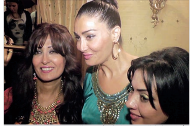
غادة عبدالرازق مع «سيدات ليونز مصر الجديدة»

تحصول حفل تكريم غادة عبدالرازق الذي أقيم في نادي «سيدات ليونز مصر الجديدة» إلى جلسة حوار حول رشاقة صاحبة «مع سبق الإصرار» ونحافتها. وخلال الحفل الذي خصص للنساء، تحدثت الحاضرات عن رشاقة الممثلة