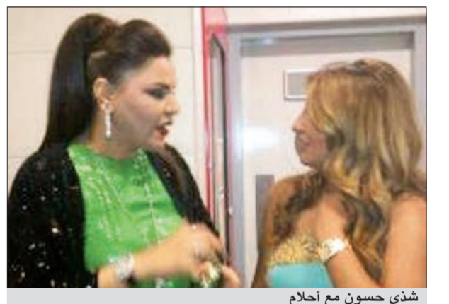
شذى حسون مع أحلام

نشرت الفنانة العراقية شذى حسون على صفحتها الخاصة على موقع التواصل الاجتماعي فيسبوك صوراً تجمعها بالفنانة أحلام بعد انتهاء الجفاء بينهما، والصور