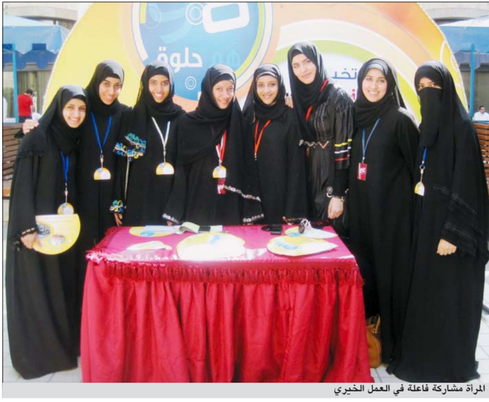
المرأة مشاركة فاعلة في العمل الخيري

تركزها ونوعية احتياجاتها، ولماذا هي محتاجة ثم وضع البرامج والخطط مستخدمين الخبرات الإغائية الميدانية في داخل البلد أو خارجه وتوثيقها، وأرى أن من الحلول استحداث جهات بحثية إسلامية مهتمة تجمع المعوقات وتضعها صياغة بحثية تسمح بوضع محل الدراسة والبحث مع إعطاء دورات تدريبية لمن يرغب في العمل بهذا المجال، والعمل على إحياء الوازع الديني في نفوس العاملين مع البحث على أهميته في الارتقاء بالفرد المسلم ومن ثم المجتمع المسلم، كما أن من الحلول تغيير فكرة العمل الخيري المتمثلة في إعطاء المواد المادية والعينية التي تاهل الأسر المحتاجة وتدريبها على العمل الذي يغنيها عن ذل السؤال والحاجة مع حث الرجل المسلم على أن يثق بنفسه المسلمات فلا يكون حجر عثرة في انخراطهن في هذا العمل بدعوى الخوف عليهن من الاختلاط بالرجال، وإنشاء مؤسسات ذات صفة محلية أو عالمية تعمل بطريقة علمية تتعاون مع جهات خيرية وإغائية معروفة ومشهورة تكسب سمعة وثقة وتعمل بنظام ولديها كوادر مدربة ومؤهلة للقيام بأعمال الإغاثة كاليهية الخيرية الإسلامية العالمية. وأيضا عن طريق توفير عاملين لسد النقص المتطوعين في بعض الحالات حتى لا تواجه المؤسسات الخيرية النقص في الكوادر عند الحاجة، واستصدار فتوى للاستقطاع من التبرعات النقدية للاستثمار حتى لا تواجه المؤسسات الخيرية العجز في الموارد كما يحدث في كثير من الأحيان، وضرورة إنشاء بنك خيري رأسماله من التبرعات أو الزكوات يساهم في مساعدة المحتاجين والمتضررين مع التوجه إلى إقامة المشروعات الصغيرة للمحتاجين ومتابعتها ومراقبتها.