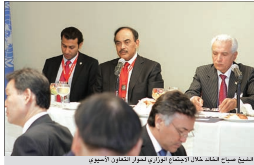
الشيخ صباح الخالد خلال الاجتماع الوزاري لحوار التعاون الآسيوي

أكد مصدر مسؤول بوزارة الأشغال أن لجنة المناقصات المركزية ستقوم خلال شهر أكتوبر المقبل بترسية 18 مشروعاً للوزارة تشمل على مشاريع للطرق وشبكات الصرف الصحي والأطوار وعدد من التقاطعات والدورات في مناطق الكويت المختلفة. وأضاف المصدر أن كلفة هذه المشاريع تبلغ نحو 153 مليون دينار تشمل جميع هذه الأعمال. وقال إن هذه المشاريع والبالغ عددها 18 مشروعاً ستنفذ بواسطة أكثر من 12 شركة بين عالمية ومحلية تقدمت بعبءاتها إلى لجنة المناقصات المركزية لتنفيذ هذه المشاريع. وكشف أن وزارة الأشغال ستقوم بمخاطبة وزارة المالية وديوان المحاسبة وعدد من الجهات والوزارات الحكومية ذات الشأن بهذه المشاريع للحصول على الموافقات لتنفيذ هذه المشاريع فوراً.