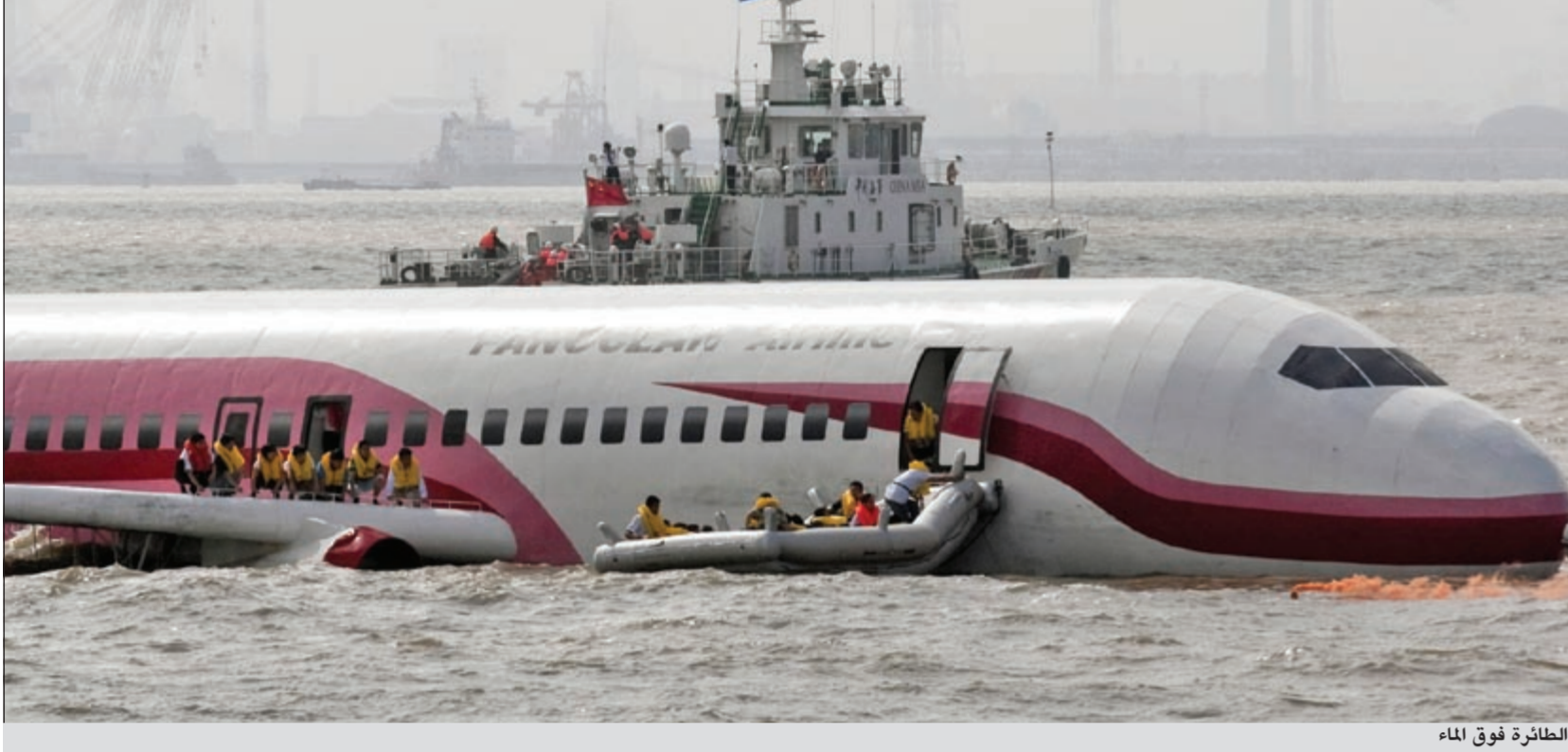
الطائرة فوق الماء

كان بعض الركاب وأفراد من طاقم الطائرة الغريقة يقفون على جناح الطائرة للنجاة بأنفسهم في انتظار انتشالهم.