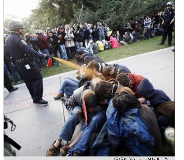
رش الطلاب برذاذ الفلفل

سان فرانسيسكو - د.ب.أ: قدم محامو جامعة كاليفورنيا الأميركية والإدعاء تسوية إلى محكمة في سكرامنتو للموافقة عليها تدفع بمقتضاها الجامعة مليون دولار كتعويضات لطلاب رشتهم الشرطة برذاذ الفلفل داخل الحرم الجامعي خلال اعتصام احتجاجي العام الماضي، حسبما ذكرت صحيفة لوس أنجليس تايمز.