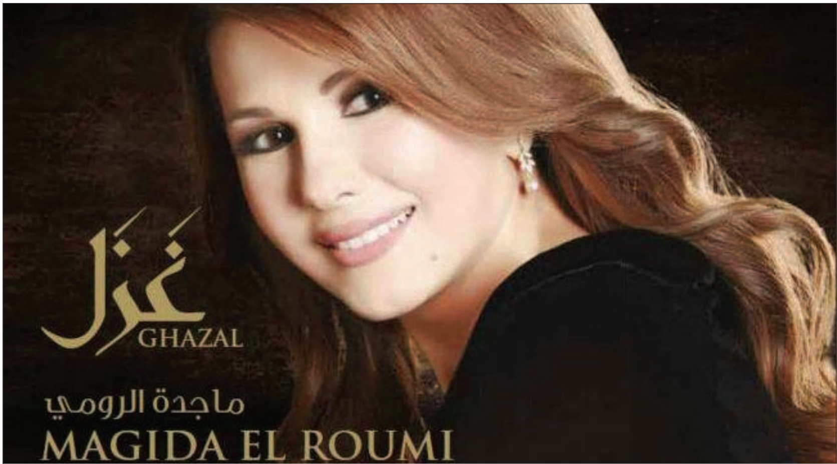
ماجدة الرومي ويوستر اليوم «غزل»

غالبا ما يطول الانتظار لتأتي النتيجة دائما أكبر من التوقعات، هكذا كان حال عشاق ماجدة الرومي الذين تلقوا اليومها المنتظر «غزل» بعد انتظار أكثر من ست سنوات منذ اليوم «اعتزلت الغرام» الذي أتى أيضا بعد حوالي ستة أعوام من اليوم «أحبك وبعد».