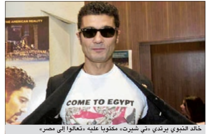
خالد النبوي يرتدي «تي شيرت» مكتوباً عليه «تعالوا إلى مصر»

حصل فيلم «المواطن» للنجم العالمي خالد النبوي على جائزة أفضل فريق عمل بمهرجان بوسطن السينمائي، وعرض الفيلم السبت