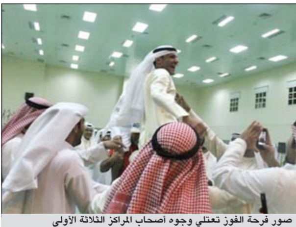
صور فرحة الفوز تعتلي وجوه أصحاب المراكز الثلاثة الأولى

ويهدف المناسبة فمن أعضاء قائمة التطوير الفائزين الثقة الغالية التي منحهم إيها المساهمون الكرام واختيارهم لهم لاستكمال المسيرة والعمل مع المجموعة لتقديم أفضل الخدمات، ورسم السياسة العامة للجمعية التي تسهم في رفع نسبة المبيعات وبالتالي زيادة الأرباح والارتقاء بالمركز المالي للجمعية.