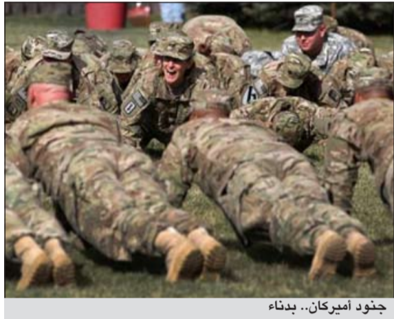
جنود أميركان.. بدناء

واشنطن - سي. إن. إن: يعتبر قادة عسكريون أميركيون أن قضية بدانة الطفولة لا يقتصر تأثيرها السلبي على الصحة فحسب بل قد تصل إلى تهديد الأمن القومي، إذ تحول السمعة دون أنخراط الشباب في الجيش. وقالت منظمة «ميشين ريدنيس» الاستشارية، في تقرير صدر مؤخرا، انه «ما من دولة كبرى أخرى يواجه فيها الجيش تحديات زيادة الوزن كما الجيش الأميركي». وتكشف تقرير المنظمة غير الربحية المشكلة من كبار القادة العسكريين المتقاعدين، ان واحدا من كل 4 شباب بالولايات المتحدة يعاني من زيادة في الوزن تحول دون انضمامه للعسكرية.