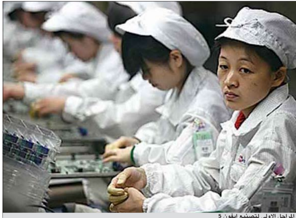
المراحل الأولى لتصنيع آيفون 5

بمناجم الفحم ومعامل الفولاذ، وأعلن عمال الشركة في وقت سابق من العام اضربا قصيرا للمطالبة بتحسين الأجور، وفي أكتوبر الماضي حثت الحكومة المحلية ادارة شركة فوكسون على الكف عن إطلاق أبخرة ضارة أثارت قلق السكان الذين يعيشون قرب المعمل.