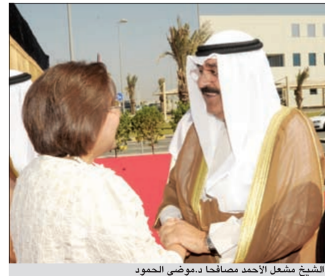
الشيخ مشعل الأحمد مصافحاً د.موضي الحمود