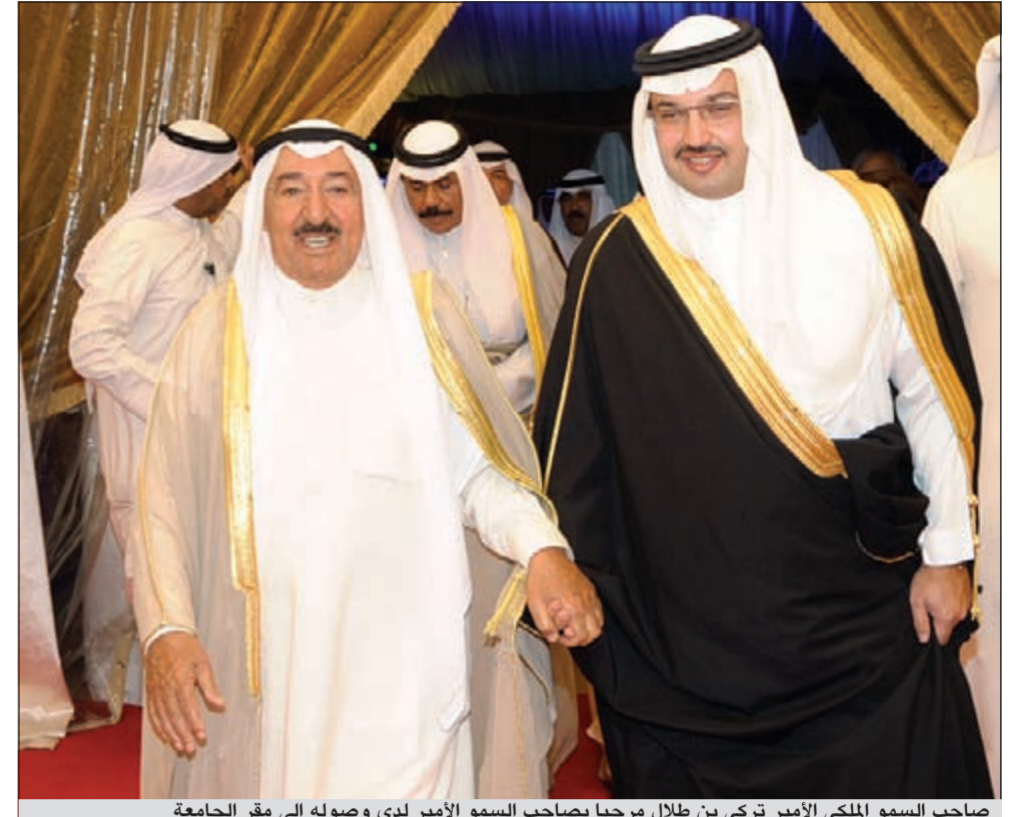
صاحب السمو الملكي الأمير تركي بن طلال مرحبا بصاحب السمو الأمير لدى وصوله إلى مقر الجامعة