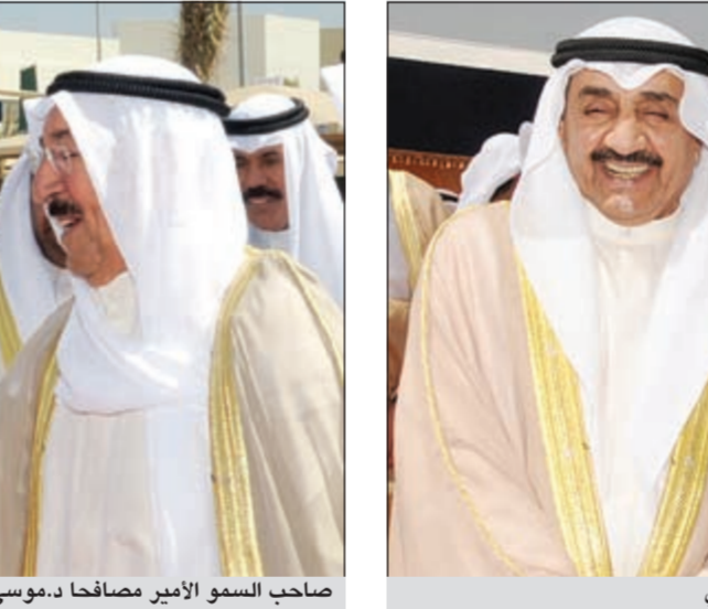
د.موسى الحمد تتوسط صاحب السمو الملكي الأمير تركي بن طلال وجاسم الخرافي