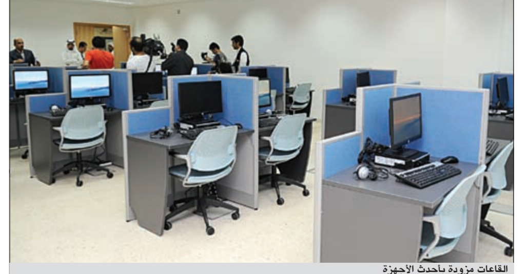
القاعات مزودة بأحدث الأجهزة

من أجواء الحفل ● وصل صاحب السمو الأمير لقر الحفل الساعة 10,15 صباحا وغادر الساعة 11. ● قام صاحب السمو الأمير الشيخ صباح الأحمد بإزاحة الستار عن لوحة الافتتاح. ● تم عرض فيلم وثائقي عن الجامعة العربية المفتوحة لتسليط الضوء على مسيرة الجامعة. ● قام الأمير تركي بن طلال بإهداء صاحب السمو هدية تذكارية. ● تم تكريم مديري الجامعة السابقين وهم: د.محمد حمدان أول مدير جامعة في الفترة من 1999 - 2001 و.د.محمد منذر صلاح تولى قيادة الجامعة في الفترة