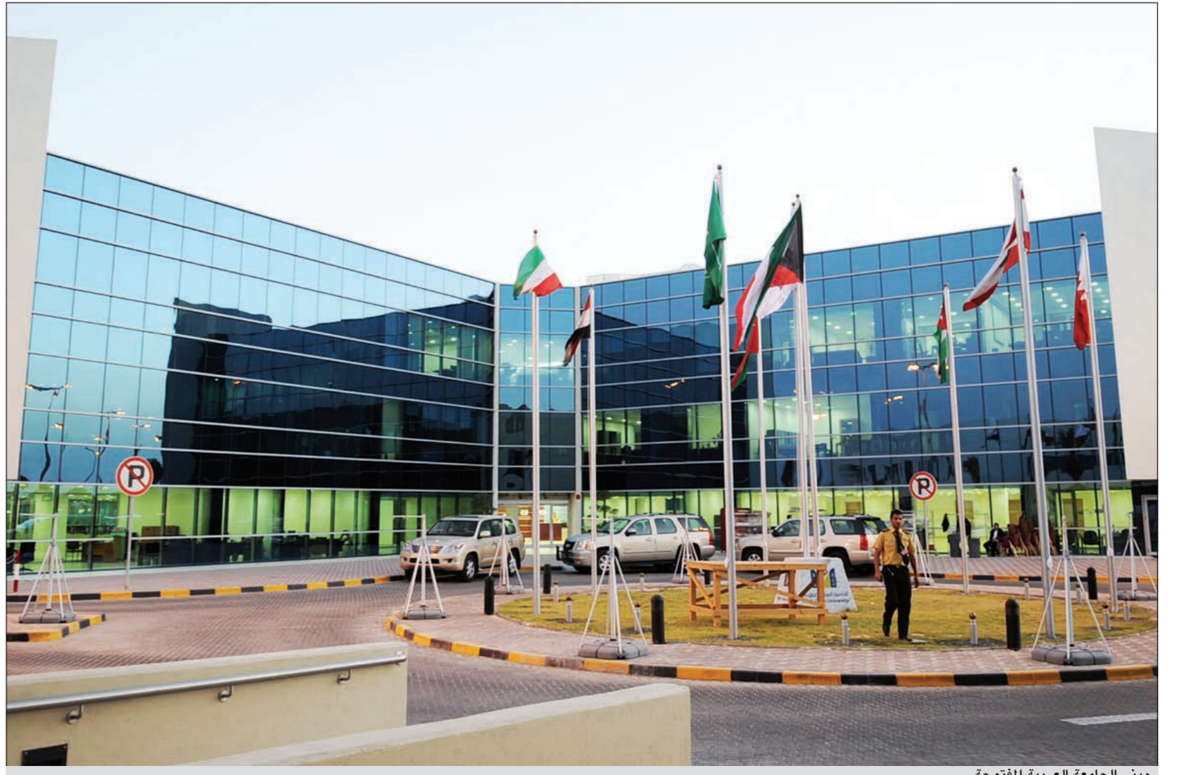
مبنى الجامعة العربية المفتوحة