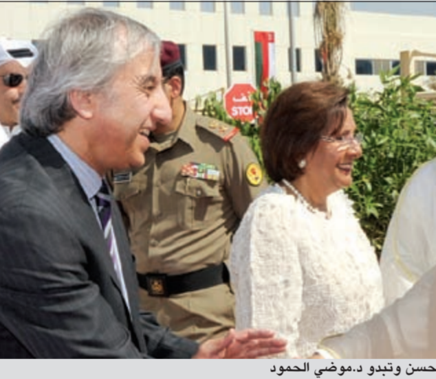
صاحب السمو الأمير مصافحا د.موسى محسن وتبدو د.موسى الحمد

لقد مر عقد كامل على انطلاق الجامعة حققت خلاله الكثير من اهدافها ومازال امامها الكثير فقد حصلت على الاعتماد الاكاديمي من اشهر هيئات الاعتماد الدولية وامتدت فروعها لتشمل سبعة قطار عربية فضلا عما في بعضها من مراكز دراسية امتدت إلى مناطق هي في امس الحاجة للتعليم الجامعي وفتحت ابواب الامل لآلاف من بناتنا وابنائنا. ان نتابع الانجازات يغري بالمرسيد من الأمال والاماني ويوسع افق التطلعات ويرفع سقف الطموحات فالأمل يحدونا إلى ان تمتد هذه التجربة إلى كل بلدان الوطن العربي العزيز لتكون هذه الجامعة متاحة لكل العرب