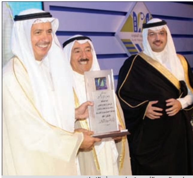
صاحب السمو الأمير مكرم د.يوسف الإبراهيم