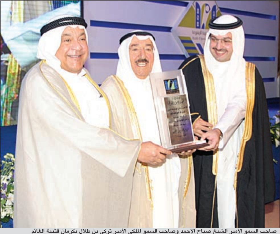
صاحب السمو الأمير الشيخ صباح الأحمد وصاحب السمو الملكي الأمير تركي بن طلال يكرمان قتيبة الغانم