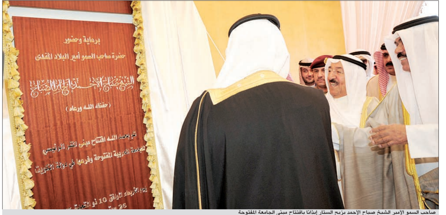
صاحب السمو الأمير الشيخ صباح الأحمد يزيح الستار إيداناً بافتتاح مبنى الجامعة المفتوحة

خلال حفل حضره ولي العهد والخرافي وكبار الشيوخ والوزراء