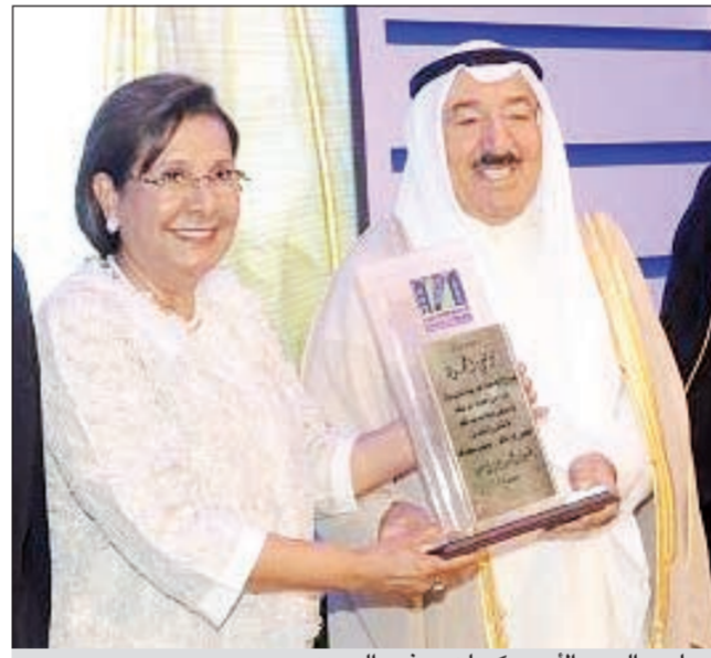
صاحب السمو الأمير مكرم د.موضي الحمود