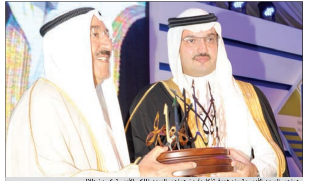
صاحب السمو الأمير يتسلم هدية تذكارية من صاحب السمو الملكي الأمير تركي بن طلال

تطرحها الجامعة ضمن خططها الاستراتيجية الثالثة ورؤاها المستقبلية كالمهندسة والحقوق والرعاية الصحية والاجتماعية بالإضافة إلى برامج الماجستير التي غدت جاهزة وستبدأ بها بعض الفروع مع مطلع العام الدراسي 2012/2013. ولايسد لي في هذا المقام من رفع اسمي آيات الشكر والعرفان لصاحب الفكرة ورعايتها وداعمتها وبانيها وهو صاحب السمو الملكي الأمير طلال بن عبدالعزيز حفظه مولاي ورعاها كفاء ما جاهد في سبيلها منذ كانت حلما يراود الخيال إلى ان غدت مؤسسة تسهم بفاعلية في توسيع افاق المعرفة والتعلم وتنمية القدرات البشرية العربية وتزويد من القدرة التنافسية للجامعة العربية المفتوحة في عالم متطور. ثم تم عرض فيلم وثائقي بعدما تفضل سموه ورعاها الله بتكريم مديري الجامعة السابقين والسادة المتبرعين. ففي نهاية الحفل تم تقديم هدية تذكارية إلى صاحب السمو الأمير الشيخ صباح الأحمد بهذه المناسبة. هذا وغادر سموه مكان الحفل بمثل ما استقبل به من حفاوة وترحيب.