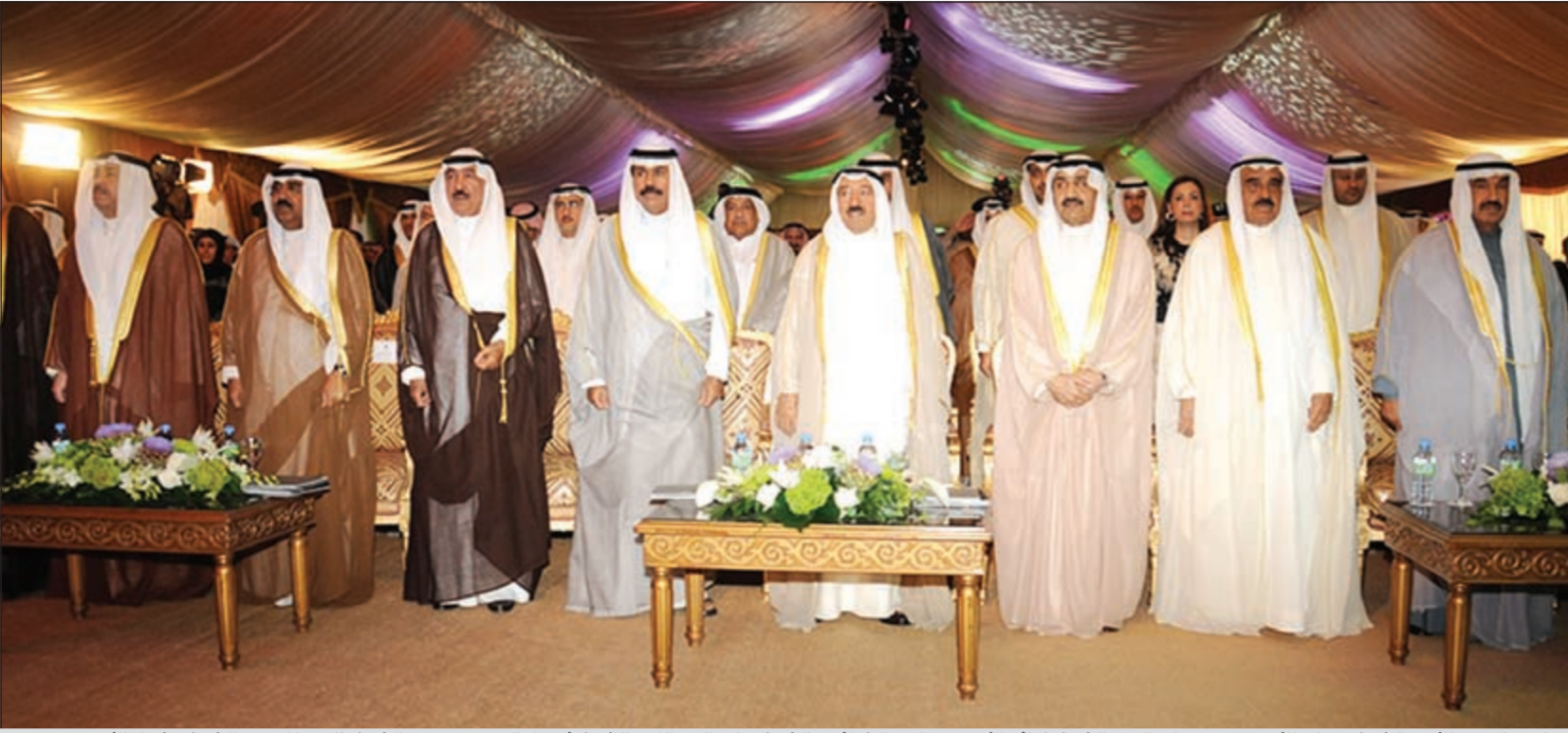
صاحب السمو الأمير الشيخ صباح الأحمد وسمو ولي العهد الشيخ نواف الأحمد وجاسم الخرافي والشيخ جابر عبدالله والشيخ فيصل السعود وسمو الشيخ ناصر الحمد والشيخ مشعل الأحمد والشيخ أحمد الحمد خلال الحفل