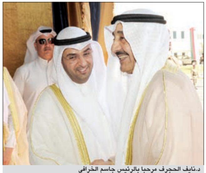
د.نايف الحجرف مرحباً بالرئيس جاسم الخرافي