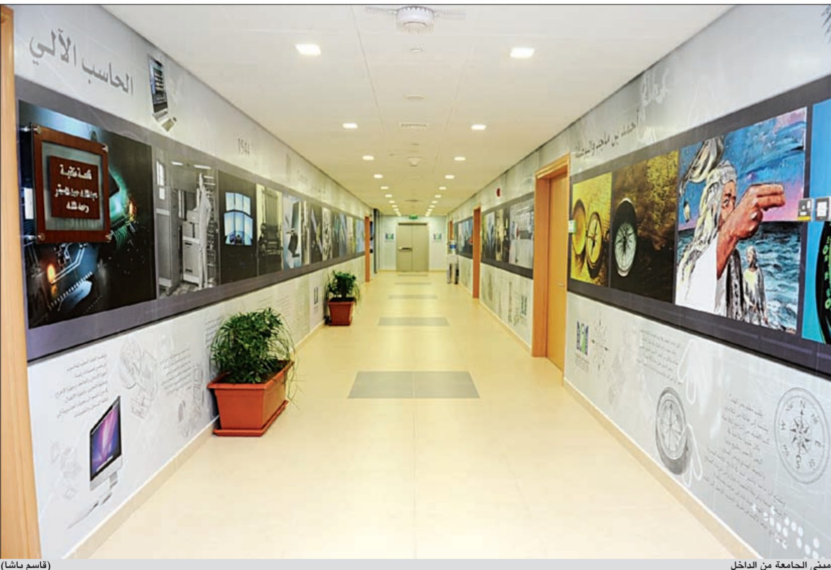
مبنى الجامعة من الداخل (قاسم ياشا)

من أجواء الحفل ● وصل صاحب السمو الأمير لقر الحفل الساعة 10,15 صباحا وغادر الساعة 11. ● قام صاحب السمو الأمير الشيخ صباح الأحمد بإزاحة الستار عن لوحة الافتتاح. ● تم عرض فيلم وثائقي عن الجامعة العربية المفتوحة لتسليط الضوء على مسيرة الجامعة. ● قام الأمير تركي بن طلال بإهداء صاحب السمو هدية تذكارية. ● تم تكريم مديري الجامعة السابقين وهم: د.محمد حمدان أول مدير جامعة في الفترة من 1999 - 2001 و.د.محمد منذر صلاح تولى قيادة الجامعة في الفترة