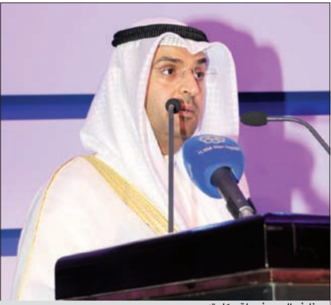
د.نايف الحجرف يلقي كلمته