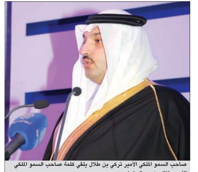
صاحب السمو الملكي الأمير تركي بن طلال يلقي كلمة صاحب السمو الملكي الأمير طلال بن عبدالعزيز

مؤسسات التعليم العالي مسؤولين واداريين وهيئة تدريسية وطلبة خالص الشكر وعظيم الامتنان على ما تولونه سموكم من اهتمام خاص بالعلم والمتعلمين.