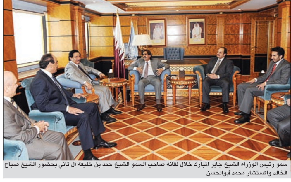
سمو رئيس الوزراء الشيخ جابر المبارك خلال لقائه صاحب سمو الأمير حمد بن خليفة آل ثاني بحضور الشيخ صباح الخالد والمستشار محمد أبو الحسن

بالبديوان الإميري محمد أبو الحسن وسفيرنا لدى الولايات المتحدة الأميركية الشيخ سالم عبدالله ومدير ادارة مكتب نائب رئيس مجلس الوزراء ووزير الخارجية الشيخ د. أحمد ناصر المحمد وأعضاء الوفد الرسمي المرافق لسموه. كما التقى ممثل صاحب سمو الأمير سمو رئيس مجلس الوزراء الشيخ جابر المبارك بمقر بعثة الكويت الدائمة في نيويورك صباح أمس، رئيس جمهورية جزر القمر د. أكيليو دوينين والوفد المرافق له. وجرى خلال اللقاء استعراض العلاقات الثنائية بين البلدين الشقيقين في شتى المجالات وسبل تنميتها إضافة الى بحث المستجدات الدولية والإقليمية والقضايا ذات الاهتمام المشترك. كما التقى سموه رئيس جمهورية شمال قبرص