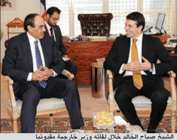
الشيخ صباح الخالد خلال لقائه وزير خارجية مقدونيا