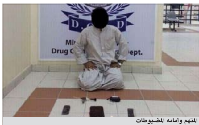
المتهم وأمامه المضبوطات

تمكنت ادارة العمليات التابعة للإدارة العامة لمكافحة المخدرات من ضبط مواطن بحوزته كيلو وربع من مخدر الحشيش بمختلف الاجسام وعلى مؤثرات عقلية وكمية قليلة من مخدر الشبو وأدوات للتعاطي. وبمواجهته بما نسب اليه اعترف بحيازته لتلك المواد بقصد الاتجار والتعاطي. هذا وقد تم احالته والمضبوطات الى جهة الاختصاص.