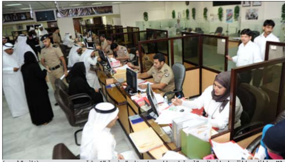
112 مواطناً ومواطنة سلموا أوراقهم القديمة تمهيداً لحصولهم على الجنسية الكويتية

يومية، لاسيما ان الإدارة بانتظار أي دفعات قادمة من مجلس الوزراء بعد ان يتم اعتمادها وهي على أهبة الاستعداد للاستقبال