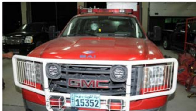
هواتف وأدوات سرقة ضبطت بحوزة «السوايق»

بيت مسدس به طلقتان وعدد (2) درنقيس يستخدمه لسرقة السيارات وعدد (3) خواتم ذهبية،