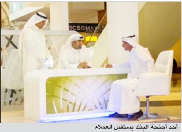
أحد أجنحة البنك يستقبل العملاء

أعلن بنك وربة عن تواجده في مول 360 من خلال جناحه الخاص المقام خلال الشهر الجاري، سعياً منه للتواصل المباشر مع أكبر عدد من العملاء وتقديم خدمة خاصة مع التعرف بالمنتجات المتميزة التي يقدمها البنك بصفحة مستمرة وذلك في الفترة من 24 - 29 الجاري. وخصص البنك أربعة مراكز حيوية أخرى في الكويت لإقامة جناحه الخاص، وتقع كل منها في مجمع الأقنيوز، مارينا مول، جامعة الكويت ومجمع الكوت على أن تأتي بشكل متتابع بعد جناحه الأول في مول 360، وتستمر هذه الحملة حتى بداية شهر يناير المقبل، ويمكن للعملاء البنك الحاليين والجدد زيارة أجنحة البنك التي تتوزع في المراكز المذكورة للاطلاع على الخدمات كافة التي يقدمها البنك، بالإضافة إلى تعريف العملاء بالمنتجات والخدمات التي يقدمها بنك وربة للاستفادة من حملة «لا تحاتي» الخاصة بحساب الراتب، والتي تمنح العملاء الجدد هدية قيمة فورية مع فرصة أو قرصتي ربح إحدى سيارات الميني كوبر، كما تمنح أجنحة بنك وربة العملاء فرصة الاستفادة من منتج المريحة الأمثل المتوافق مع أحكام الشريعة الإسلامية للتيسير على العملاء في تمويل شراء مستلزماتهم الشخصية مع تسهيلات قيمتها على دفعات شهرية سهلة، حيث إن عملية التقسيط تتم على فترات تصل إلى 15 سنة بحد أقصى 6 أشهر كحد أدنى، وتشمل خدمة المراجعة بناء وتمويل المنازل.