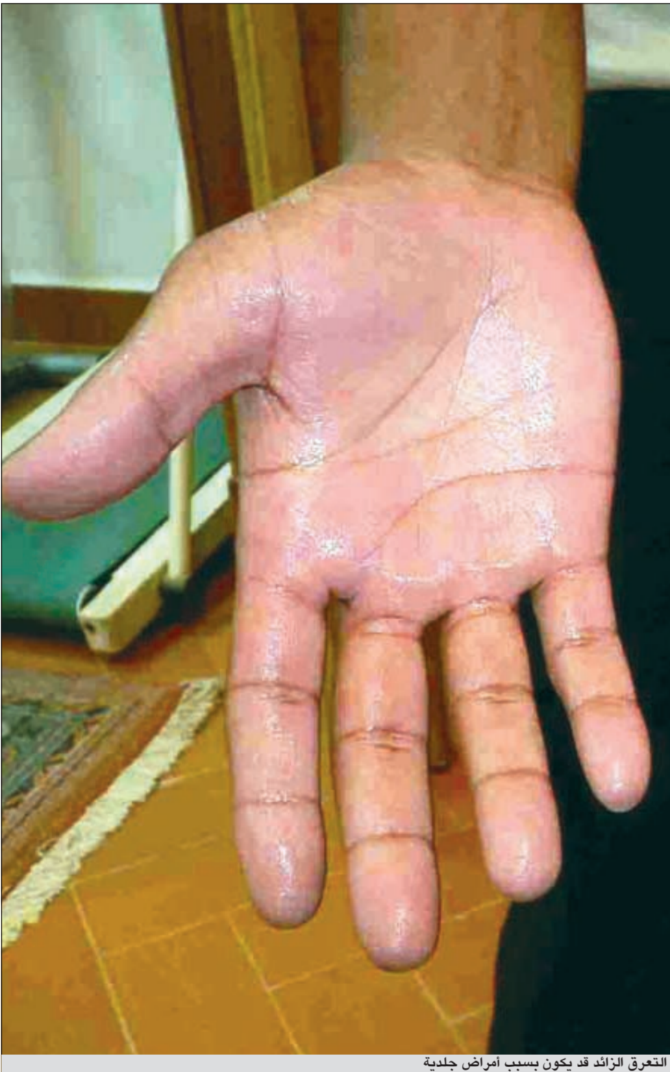
التهرق الزائد قد يكون بسبب أمراض جلدية

كذلك من الاسباب التهاب المجرى التناسلي عند الرجل أو المرأة وعدم نزول الخصيتين أو أحدهما في كيس الصفن، ارتفاع درجات الحرارة، الإصابة على الخصيتين، انسداد القنوات