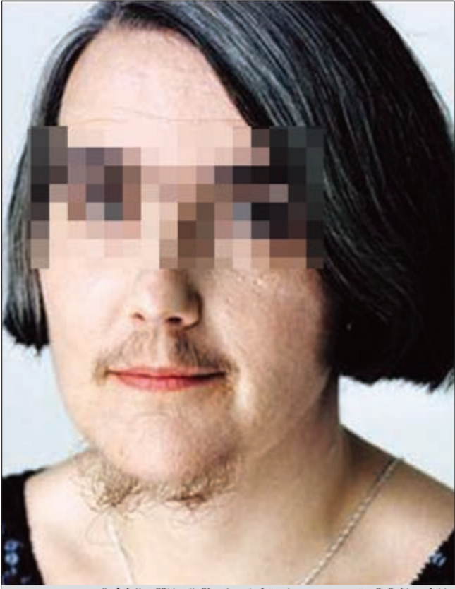
المشعرانية قد تكون بسبب استخدام ماكينة الحلاقة والشفرة

تساقط الشعر تساقط الشعر هل هو بسبب الهرمونات أو بسبب مرض في بصيلة الشعر؟ ● الأسباب التي تؤدي إلى تساقط الشعر، تختلف عند