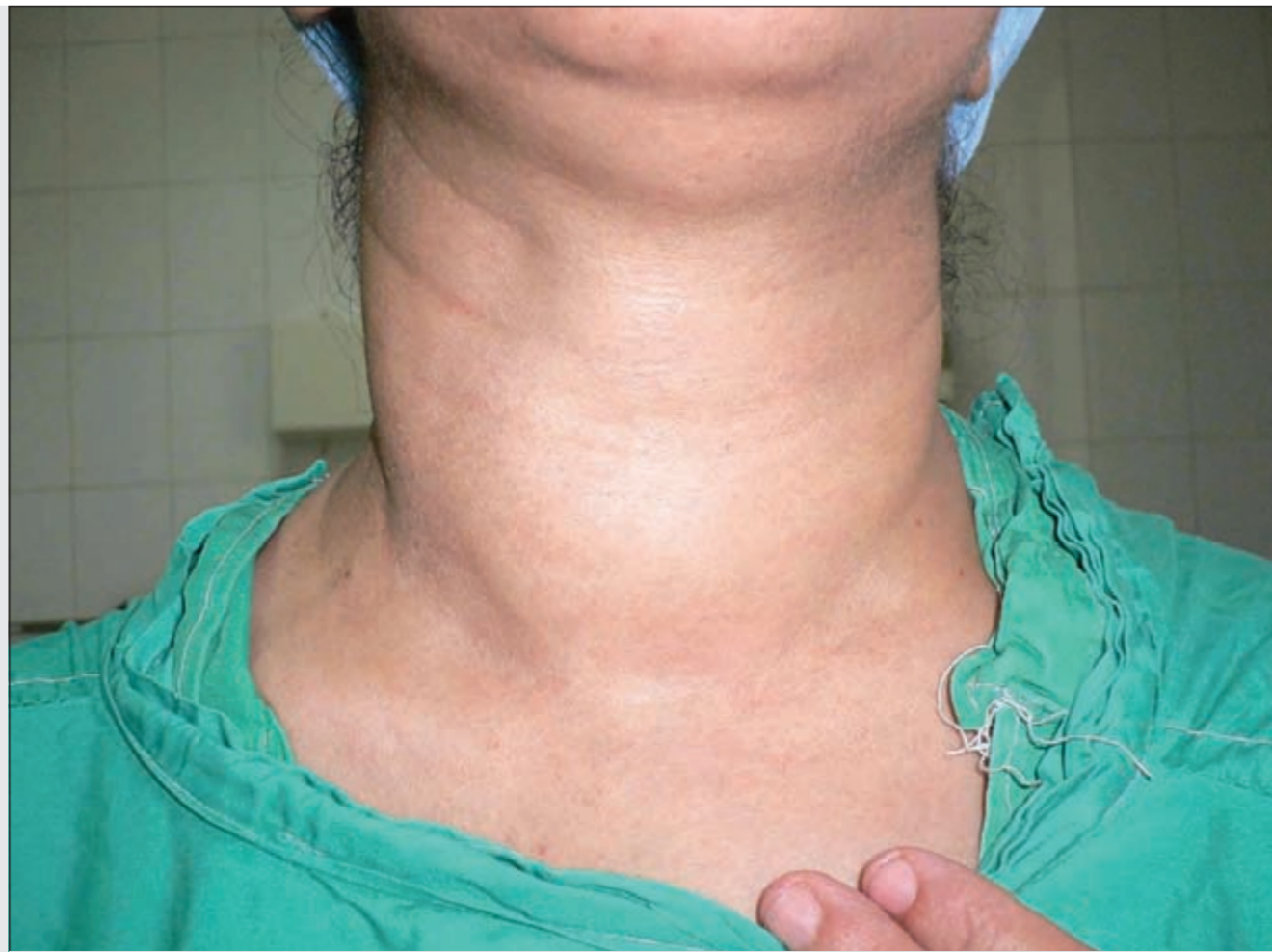
تضخم الغدة الدرقية

أولاً: يجب ان تكون هناك مفكرة يومية تدون فيها قياسات ضغطك وتراقبه بها وتختلف عدد المرات التي يجب فيها قياس الضغط اسبوعياً او حتى يومياً بمقدار درجة التحكم بارتفاع الضغط الشرياني.. فمثلاً عند ابتداء العلاج يطلب من المريض قياس الضغط مرتين يومياً ومساءً، ثم بعد ذلك اذا استقر ضغطه فيكون مرتين اسبوعياً، وليس هناك غنى عن مراقبة الضغط في المنزل لأنه ببساطة اذا لم تتحكم هذه الادوية التي تتناولها في الضغط فليس هناك فائدة مرجوة منها، ويجب على كل مريض ضغط ان يحضر مفكرة الضغط معه عند مراجعة طبيبه، وذلك لأن الابحاث الطبية أثبتت بما لا يدع مجالاً للشك ان قياس الضغط في العيادة لا يعطي فكرة عن مقدار التحكم في الضغط سواء كان ذلك سلباً او إيجابياً (اي بمعنى اذا كانت قراءة الضغط بالعيادة مرتفعة فلا يعني ذلك المريض غير متحكم (او بالعكس) بضغطه بالتالي فلا تستطيع زيادة جرعة الدواء بناء على تلك القراءة فقط وفي المقابل اذا كان قياس ضغط العيادة طبيعياً فلا يعني ذلك انك متحكم في ضغطك دوماً، ولذلك وجود المفكرة الشخصية لقياس الضغط تسهل على الطبيب تلك المهمة كثيراً. ويلجأ الطبيب لقياس الضغط لمدة 24 ساعة اذا كان هناك شك في مدى تحكم المريض في ضغطه، خصوصاً من لديه تباين بين قراءات المنزل وقراءات العيادة، او من كان لديهم الضغط متارجحاً بين الطبيعي وغير الطبيعي.