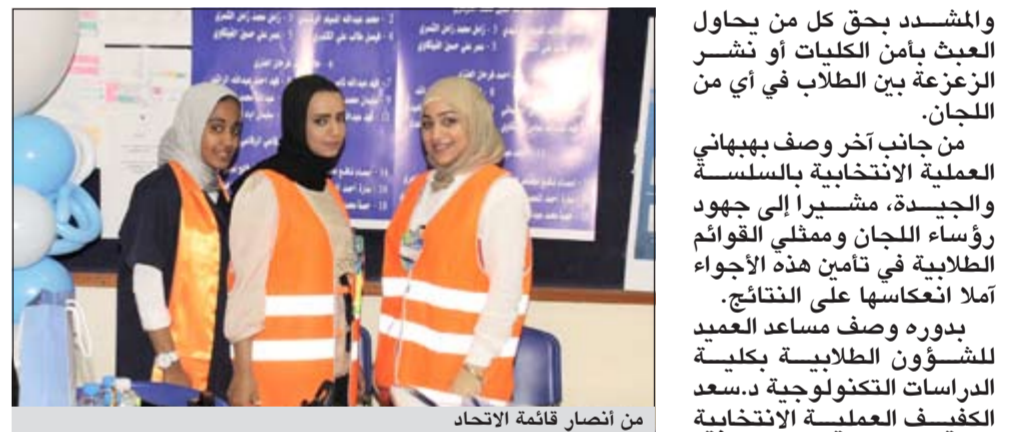
من انصار قائمة الاتحاد

والمشدد بحق كل من يحاول العبث بأمن الكليات أو نشر الزعزعة بين الطلاب في أي من اللجان.