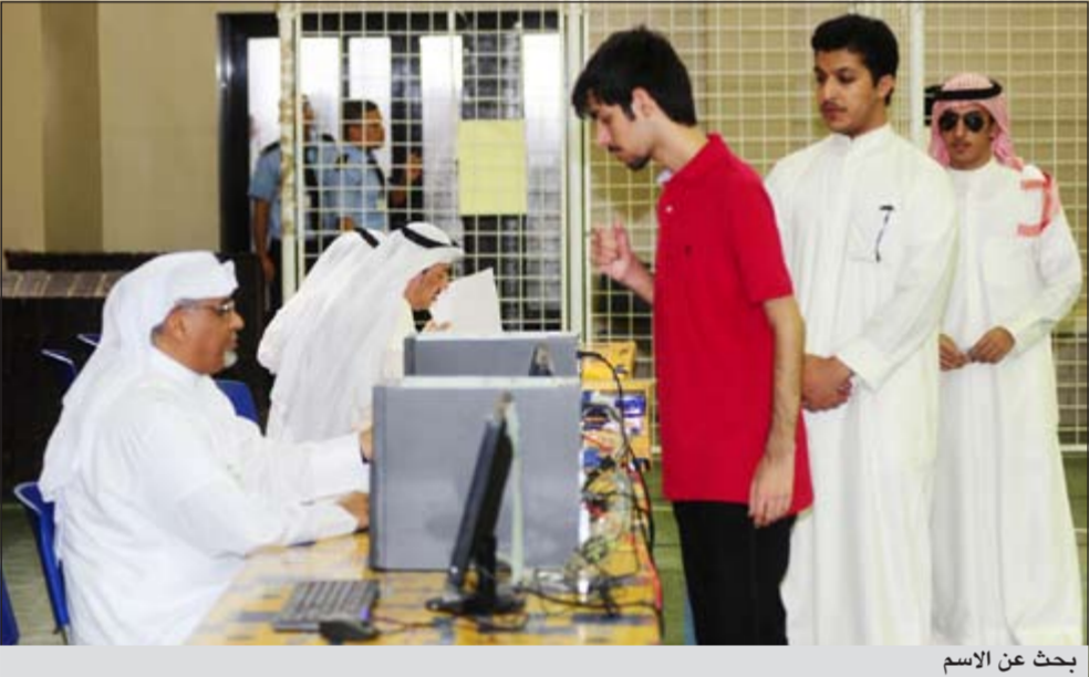
بحث عن الاسم