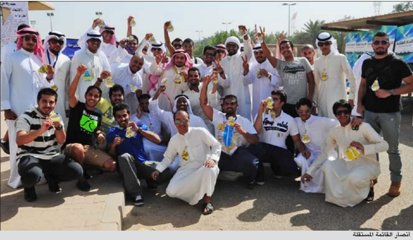
انصار القائمة المستقلة