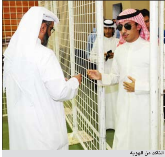
التأكد من الهوية