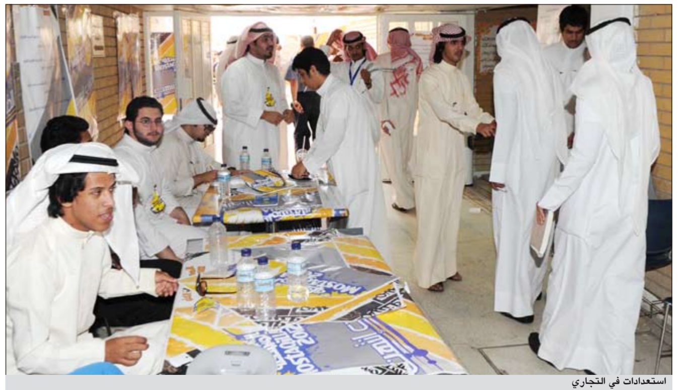
استعدادات في التجاري