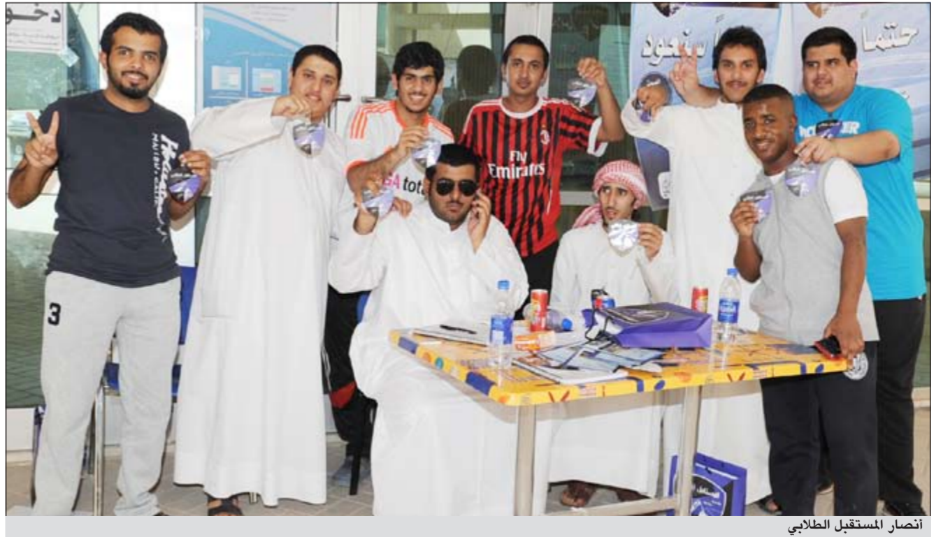
انصار المستقبل الطلابي