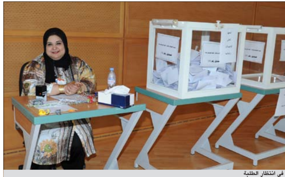
في انتظار الطلبة