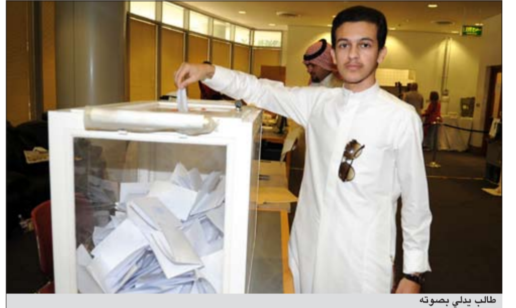
طالب يدلي بصوته