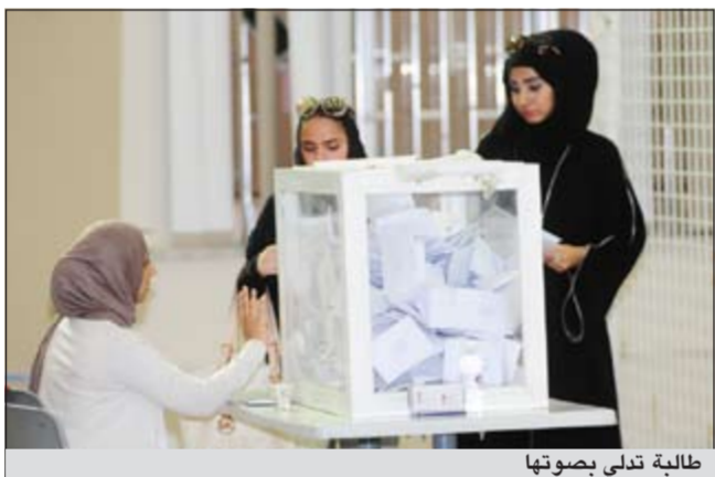
طالبة تدلي بصوتها

المستقبل الطلابي نايف العبيوي فقد قال انه يفترض أن تبدأ عملية التصويت في تمام الساعة الثامنة صباحاً مثل السنوات الماضية، ولكن الوضع العام للمعهد العالي للطاقة جيد ولكن هناك قصور عن الجهة المسؤولة في عملية تنظيم الانتخابات وأن لا تمتلك للكوادر البشرية الكافية لتنظيم العملية الانتخابية. وأضاف العبيوي أن هناك مشاكل تصادف الطلبة في عملية التصويت بكلية الدراسات التكنولوجية بسبب انتظارهم خارج مبني التصويت معرضين لأشعة الشمس وهذا يسبب عزوفا طلابيا لعملية التصويت والمشاركة الانتخابية.