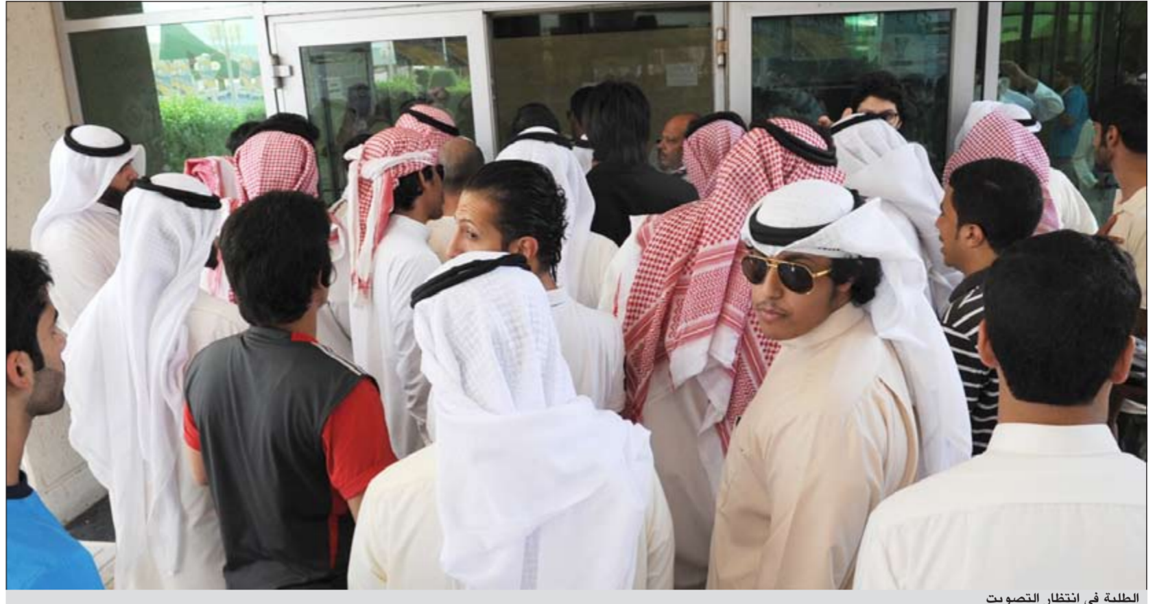
الطلبة في انتظار التصويت

أجواء هادئة سادت الانتخابات وإقبال متواضع من الطلبة