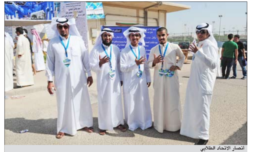
انصار الاتحاد الطلابي