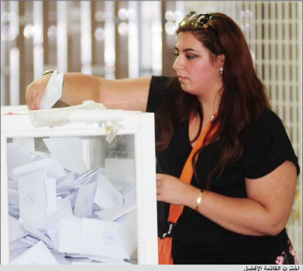
اخترت القائمة الأفضل