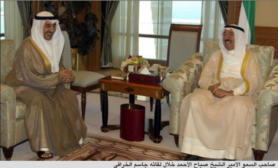
صاحب السمو الأمير الشيخ صباح الأحمد خلال لقائه جاسم الخرافي

استقبل صاحب السمو الأمير الشيخ صباح الأحمد بقصر السيف صباح أمس رئيس مجلس الأمة جاسم الخرافي. كما بعث صاحب السمو الأمير الشيخ صباح الأحمد ببرقية تهنئة إلى الرئيس مالاو بكاي سنها رئيس جمهورية غينيا بيساو الصديقة، عبر فيها سموه عن خالص تهنئته بمناسبة العيد الوطني لبلاده متمنياً له موفور الصحة والعافية وللبلد الصديق دوام التقدم والإزدهار. وبعث سمو ولي العهد الشيخ نواف الأحمد ببرقية تهنئة إلى الرئيس مالاو بكاي سنها رئيس جمهورية غينيا بيساو الصديقة، عبر فيها سموه عن خالص تهنئته بمناسبة العيد الوطني لبلاده، متمنياً له موفور الصحة والعافية. كما بعث سمو رئيس