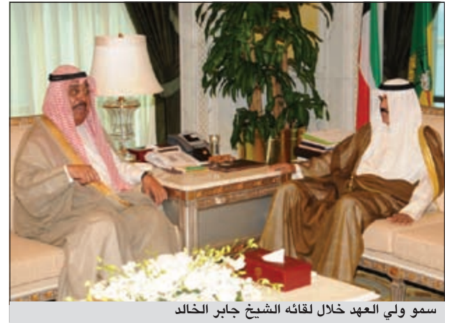
سمو ولي العهد خلال لقائه الشيخ جابر الخالد

الشيخ نواف الأحمد في ديوانه بقصر السيف أمس محافظاً الأحمدي الشيخ د. إبراهيم الدعيج. واستقبل سموه بقصر السيف