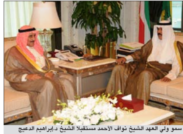
سمو ولي العهد الشيخ نواف الأحمد مستقبلاً الشيخ د. إبراهيم الدعيج

الشيخ نواف الأحمد في ديوانه بقصر السيف أمس محافظاً الأحمدي الشيخ د. إبراهيم الدعيج. واستقبل سموه بقصر السيف