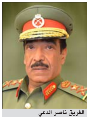
الفريق ناصر الدعوي

دماء جديدة. وأشار وكيل الحرس الوطني إلى أنه روعي في الهيكل التنظيمي مواكبته للمستجدات والتطورات التي يمر بها الحرس الوطني لتحقيق عدد من الأهداف المتمثلة في سرعة اتخاذ القرار وإجراء عملية الرقابة والمحاسبة والإشراف المباشر وتحديد التبعية والمسؤولية ووضع العسكري المناسب في المكان المناسب استناداً إلى تخصصه وتأهيله وكفاءته. وأشار الفريق الدعوي إلى أن الهيكل أسرى مراكز الثقل والاهتمام في تنفيذ المهام على أكمل وجه من خلال الاهتمام بالتدريب القتالي والفني لرفع الكفاءة القتالية والأمنية لدى قوات الحرس الوطني وإيراز دور فرع التخطيط الاستراتيجي في الإشراف والتقييم على الأهداف الإستراتيجية لقيادات الحرس الوطني، ودعم الكامل لمديرية التفيتش والرقابة لإبراز نقاط الضعف والقوة في الأداء على كافة الأصعدة. وأضاف وكيل الحرس الوطني أن هناك توجيهات من القيادة