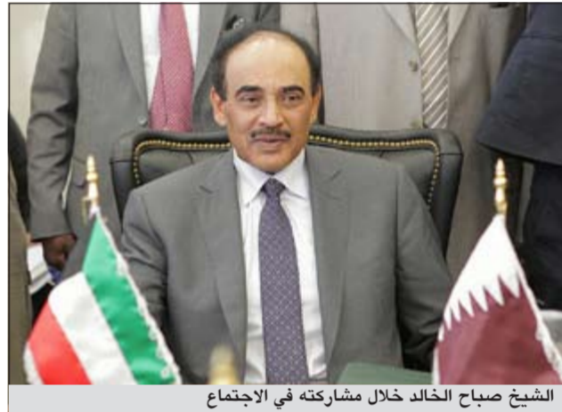
الشيخ صباح الخالد خلال مشاركته في الاجتماع

الأسبوع، مؤكداً أن القضية حاضرة على جدول الأعمال مع كل الجهات التي سيتم الاجتماع معها وأن المجلس الوزاري يولي قضية سورية جل اهتمامه. وفي ما يتعلق بالملف النووي الإيراني قال الأمين العام للمجلس إن موقف دول مجلس التعاون واضح وستتم مناقشة الملف وطرحه، وعمما إذا كانت دول مجلس التعاون ستساند طلب فلسطين الحصول على عضو بصفة مراقب في الأمم المتحدة قال إن دول مجلس التعاون الأعضاء في الجامعة العربية وتدعم كل قراراتها. ويشترك الشيخ صباح الخالد في عضوية الوفد الكويتي إلى أعمال الدورة 67 للجمعية العامة برئاسة ممثل صاحب السمو الأمير الشيخ صباح الأحمد سمو رئيس مجلس الوزراء الشيخ جابر المبارك.