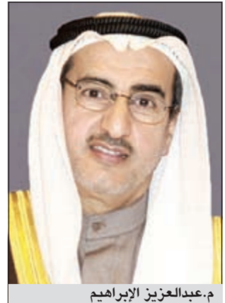
م. عبدالعزیز الیبراهیم

وافق مجلس الوزراء على اعتراض وزير الكهرباء ووزير الدولة لشؤون البلدية م. عبدالعزیز الیبراهیم على 6 قرارات للمجلس البلدي. وتضمنت قرارات المجلس التالي: القرار الاتي نصه الموافقة على اعتراض وزير الدولة لشؤون البلدية على بعض القرارات الصادرة عن المجلس البلدي في اجتماعه رقم (2012/10) المتخذ بتاريخ 2012/5/14، التالي: ● بشأن «الموافقة على الطلب المقدم من النادي الرياضي الرياضي للمعاقين بالسماح للنادي بعمل اعلانات تجارية