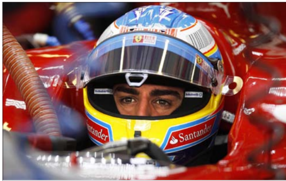
الإسباني فرناندو الوونسو يسعى لإحراز سباق سنغافورة

وقال اليغري لفتاة نادي ميلان: «لم يحدث شيء مع بيبيو، فقط وفقاً لثقافة تبادلنا خلالها الأراء». من جانبه قال إنزاغني: «لم تحدث مشاجرة.. وكانت «لا غازيتا ديللو سيور» أشارت إلى حدوث خلاف حاد خلال التدريبات بين إنزاغني واليفري، وانتهى الأمر بإهانة كل منهما الآخر».