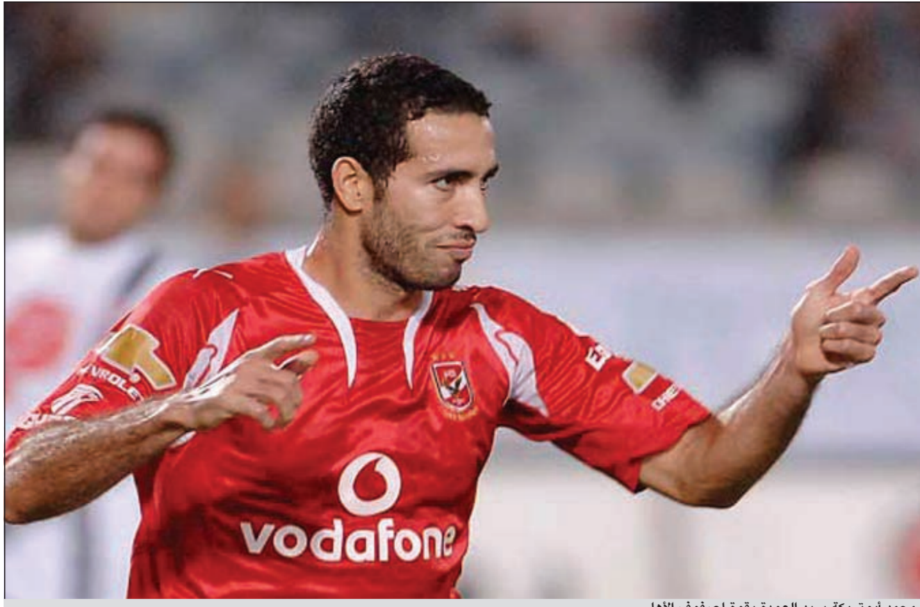
محمد أبو تريكة يبريد العودة بقوة لصفوف الأهلي