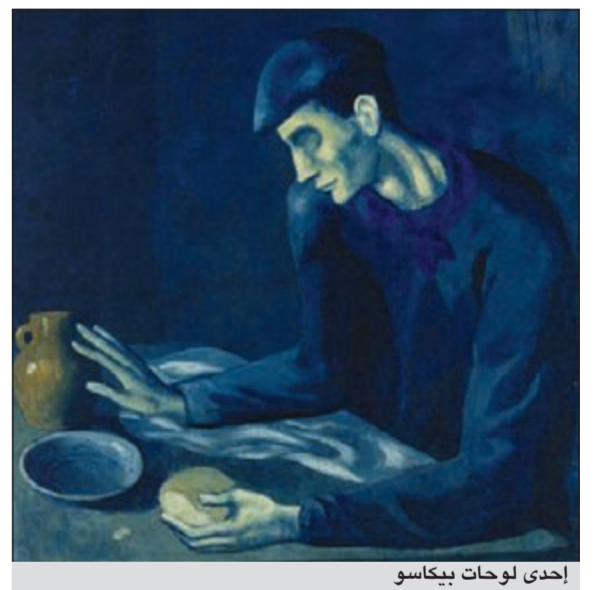
إحدى لوحات بيكاسو

إيطاليا - أ.ف.ب: توقع منظمو معرض يتضمن حوالي 250 عملا للفنان بابلو بيكاسو في بالاتزو ريبالي في ميلانو وهو الثالث للرسام الإسباني منذ العام 1953، إقبالا كثيفا من محبي الفن.