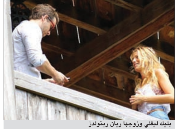
بليك ليفلي وزوجها ريان رينولدز

حصلت الممثلة الأميركية بليك ليفلي على أسبوع غسل واحد بعد زواجها من الممثل ريان رينولدز في التاسع من سبتمبر الجاري، فقد عادت الممثلة إلى العمل حيث شوهدت في موقع تصوير مسلسلها الجديد الأثني عشر 17 سبتمبر الجاري. ليفلي وريينولدز كانا قد تزوجا بعيدا عن أعين الإعلام بمرزعة «بون هول» الأثرية في جنوب كاليفورنيا، وشوهدت ليفلي في اليوم التالي وهي تقبل زوجها وخاتم الخطوبة الذي يبلغ 2 مليون دولار بيديها اليسرى.