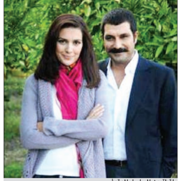
لقطة من المسلسل الموقوف

وكالات: بعد أن أصبح النجم التركي بولنت آينال الشهير بـ «يحيى» أبا، لم يحالفه الحظ فنيا حيث أوقفت قناة دي التركية عرض مسلسله الجديد «أحببت طفلة»، لعدم تحقيقه نسبة مشاهدة عالية كأعمال الدرامية الأخرى، أو حتى بنسبة أقل.