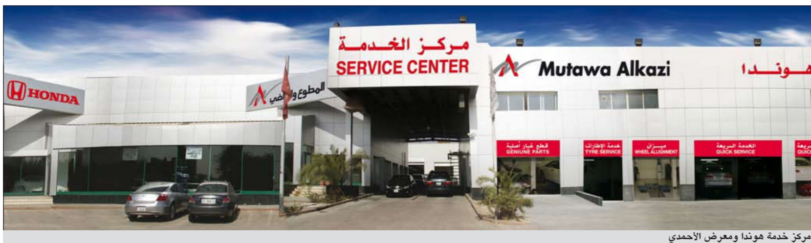
مركز خدمة هوندا ومعرض الاحمدى