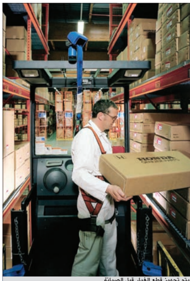
يتم تجهيز قطع الغيار قبل الصيانة

وموديلات سيارات هوندا، سواء من خلال مراكز الخدمة المتعددة أو من خلال طلب تلك القطع من الخارج وشحنها جوا حفاظا على وقت العميل وبالسعر الأصلي، ومن دون أن يتم تحميله تكاليف الشحن الجوي، وذلك انطلاقا من الالتزام الجدي للشركة تجاه جميع عملائها في الكويت من مواطنين ومقيمين للارتقاء بما يقدم من مزايا تصل بالشركة إلى هدف الخدمة الأفضل مع الحفاظ على جاهزية السيارة لمدة أطول بواسطة فريق العمل المتمك素 والمؤهل تأهلا عاليا من حيث الخبرة والدورات التدريبية والبرامج المكثفة التي جعلت ورش الصيانة شبيهة بخلايا النحل من حيث التنظيم والجد في العمل والإخلاص في إنجاز أعمال الصيانة والإصلاح بأسرع وقت حفاظا على وقت العملاء، حيث استطاعت الشركة أن تنجز أعمال الصيانة للغالبية العظمى من السيارات في اليوم نفسه مع ضمان أفضل خدمة.