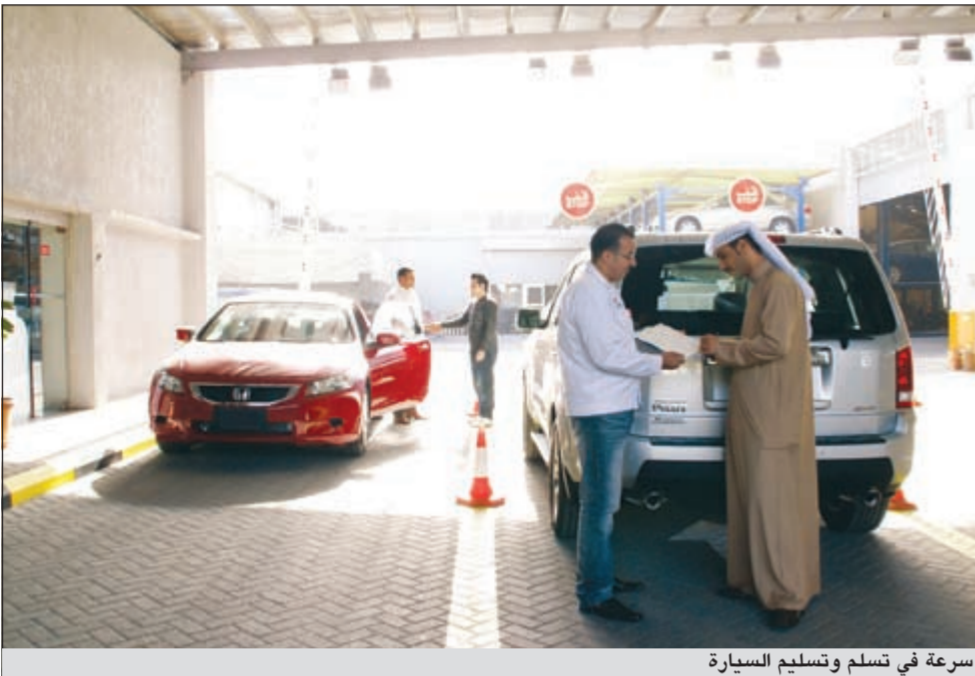
سرعة في تسليم وتسليم السيارة

ولضمان خصوصية عملاء الشركة فقد حرص القائمون على الشركة على إيجاد صالات انتظار خاصة بالسيدات وأخرى خاصة بالرجال، وتوفير خدمة الإنترنت ليتمكن أصحاب السيارات الخاضعة للتصليح من إنجاز وإتمام بعض الأعمال