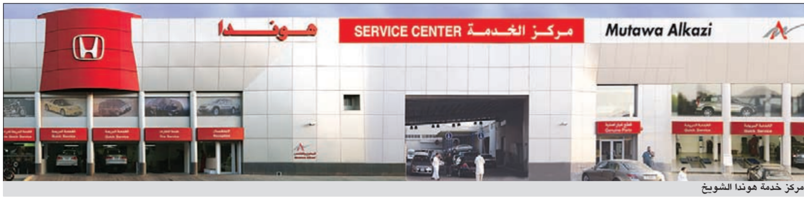
مركز خدمة هوندا الشويخ