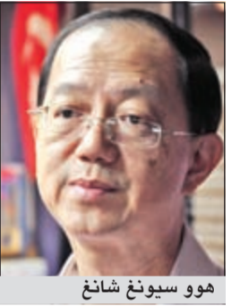
هوو سيونغ شانغ

جوهو بارو (ماليزيا) - كونا: أشاد وزير ولاية جوهو الماليزية هوو سيونغ شانغ امس بالاستثمارات الكويتية والشرق أوسطية في مشروع «إسكندر ماليزيا»، والذي يعد من أهم المشاريع التطويرية. وقال شانغ في تصريح لـ«كونا» إن بيت التمويل الكويتي (بيتك) يعد من أهم الشركاء في تطوير مشروع إسكندر الذي يضم اتحادا عالميا من الشركاء التجاريين، مفيدا بأن المشروع عرض على العديد من الشركات ومنها بيت التمويل الكويتي لإنشاء جامعات عالمية في المدينة التعليمية التابعة للمشروع الذي يتوقع الانتهاء منه مع حلول 2025. وأضاف أن المشروع يعد من أهم المشاريع التي تهتم بها الحكومة الماليزية وتقوم بدعمها دعما كاملا من خلال تسهيل عملية الضرائب ورفع بعض القيود على المستثمرين الأجانب فيما يتعلق بملكية الأراضي وتسهيل مزاوله الأعمال التجارية في منطقة المشروع الذي تبلغ مساحته 2217 كيلومترا مربعا أي ثلاثة أضعاف مساحة سنغافورة. وأشار الى ان مشروع إسكندر يضم مناطق رئيسية وهي «جوهو بارو» و«نوساجايا» وتطور المنطقة الصناعية الشرقية والمنطقة الصناعية الغربية بالإضافة الى المنطقة التطويرية والسكنية، لافتا الى ان ماليزيا قد استقطبت بعد مرور ست سنوات من بدء المشروع أكثر من 100 مليار رينجت ماليزيا من الاستثمارات المحلية والأجنبية. وأوضح شانغ أن الحكومة الماليزية اتفقت أمولا طائلة لتطوير البنية التحتية للمشروع وقد نجحت في استقطاب رؤوس الأموال إليه. وقال أن ولاية جوهو تعد المنفذ الجنوبي ماليزيا لاسيما الى سنغافورة واندونيسيا، مفيدا بأن عدد زوار الولاية عبر المنافذ البحرية والبرية يتراوح بين 12 و13 مليون زائر منهم